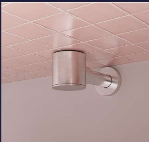
Encelade Gain de place

Rituel, une vasque design à la silhouette aussi douce que brute, pensée pour sublimer vos rituels de bien-être. Fournie avec sa bonde en céramique. Mitigeur et siphon ne sont pas fournis avec. Existe également en lave-mains.