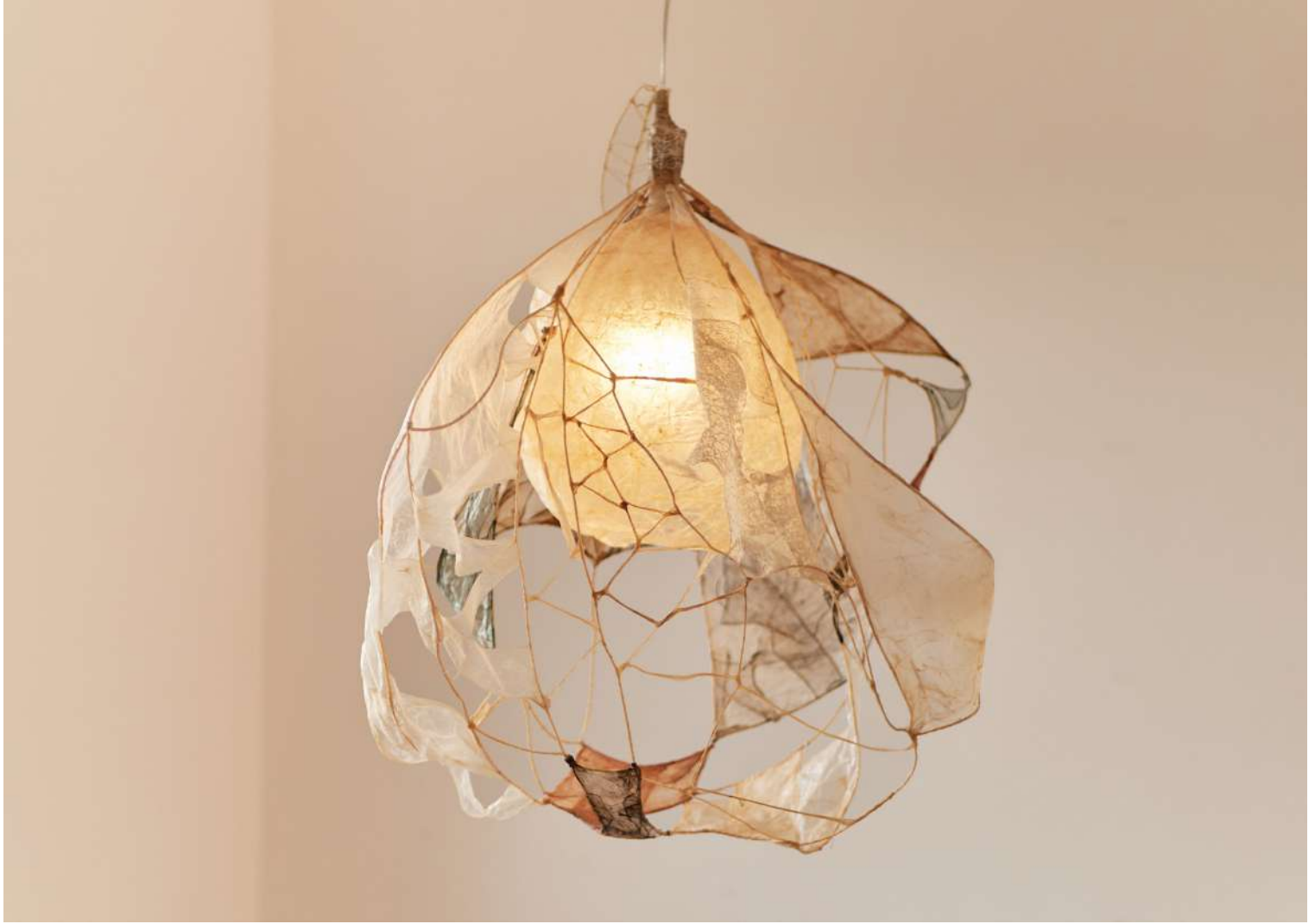
Multi 1, 2024, structure filaire en chutes d'intestins, feuilles d'intestins teintées, teintage variable, L 70 cm, l 50 cm, H 50 cm

Dans un souci constant d'expérimentation, il développe un vocabulaire de formes, transfigurant les restes d'intestins en papier, tube, feuille ou fil, allant jusqu'à les teinter à l'encre de seiche ou à l'aide de racines. À partir de cette encyclopédie du possible, il crée des sculptures fonctionnelles qui redessinent les limites de la matière, génèrent un artisanat décalé et ouvrent un champ de possibilités insoupçonné.