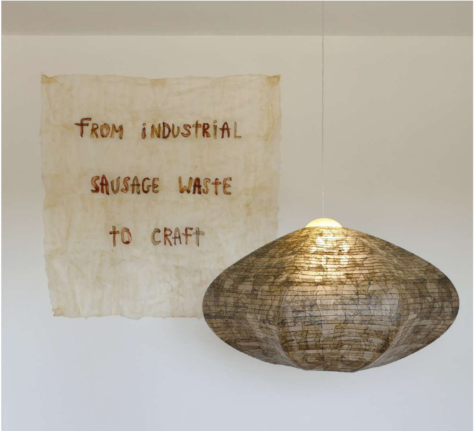
Série sarogu : Holm black, 2025, structure filaire faite d'intestins, chutes de l'industrie agro-alimentaire, encre de seiche, Ø 90 cm, H 45 cm

Né à Paris en 1996, Thibault Philip est un designer et artiste diplômé de l'EESAB Rennes en 2021. Il a notamment complété sa formation lors de périodes d'études à l'Université des Arts de Poznan, auprès de Marlène Huissoud à Paris et de Nacho Carbonell à Eindhoven.