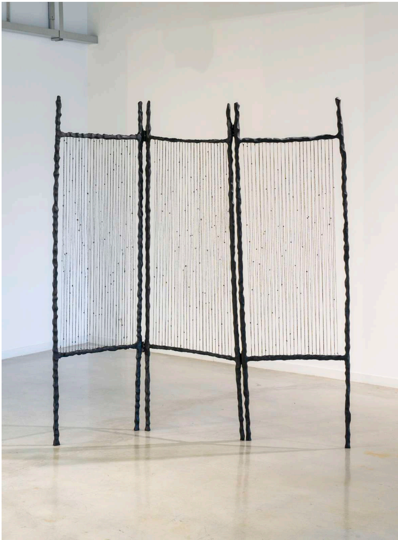
A twisted desire to see you again, vue d'exposition, Love Waves, 2024, Quatre, Rennes; pin, intestins tréssés, encre de seiche L 180 cm, H 220 cm, Ph: Stéphane Mahé