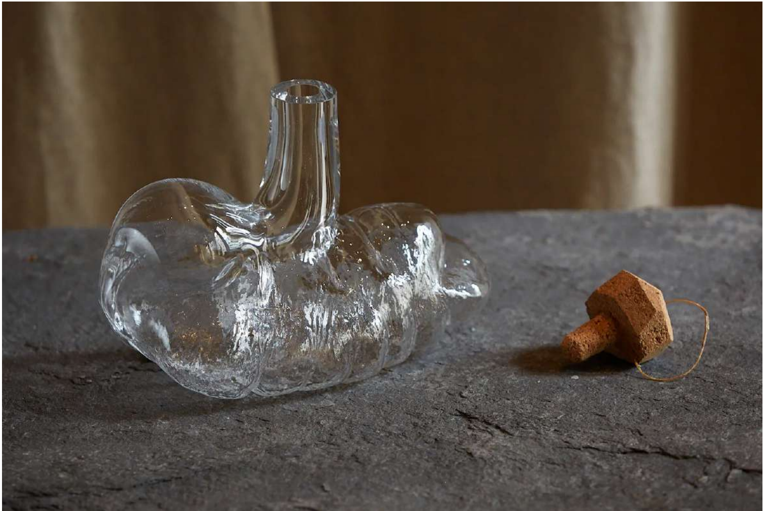
Service/Viscère, galerie l'Œil de KO, 2023, verre soufflé dans moule fait en organes, Dim variable, Ph : Œil de KO