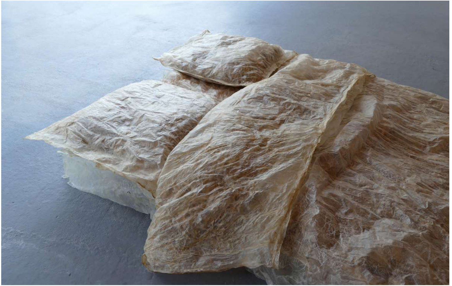
Sleep, vue d'exposition, Once upon a time: a sleep, a view and a whisper, 2024, Quinconce Galerie, paille, draps en chutes d'intestins, L 190 cm, l 140 cm, Ph : Thibault Philip