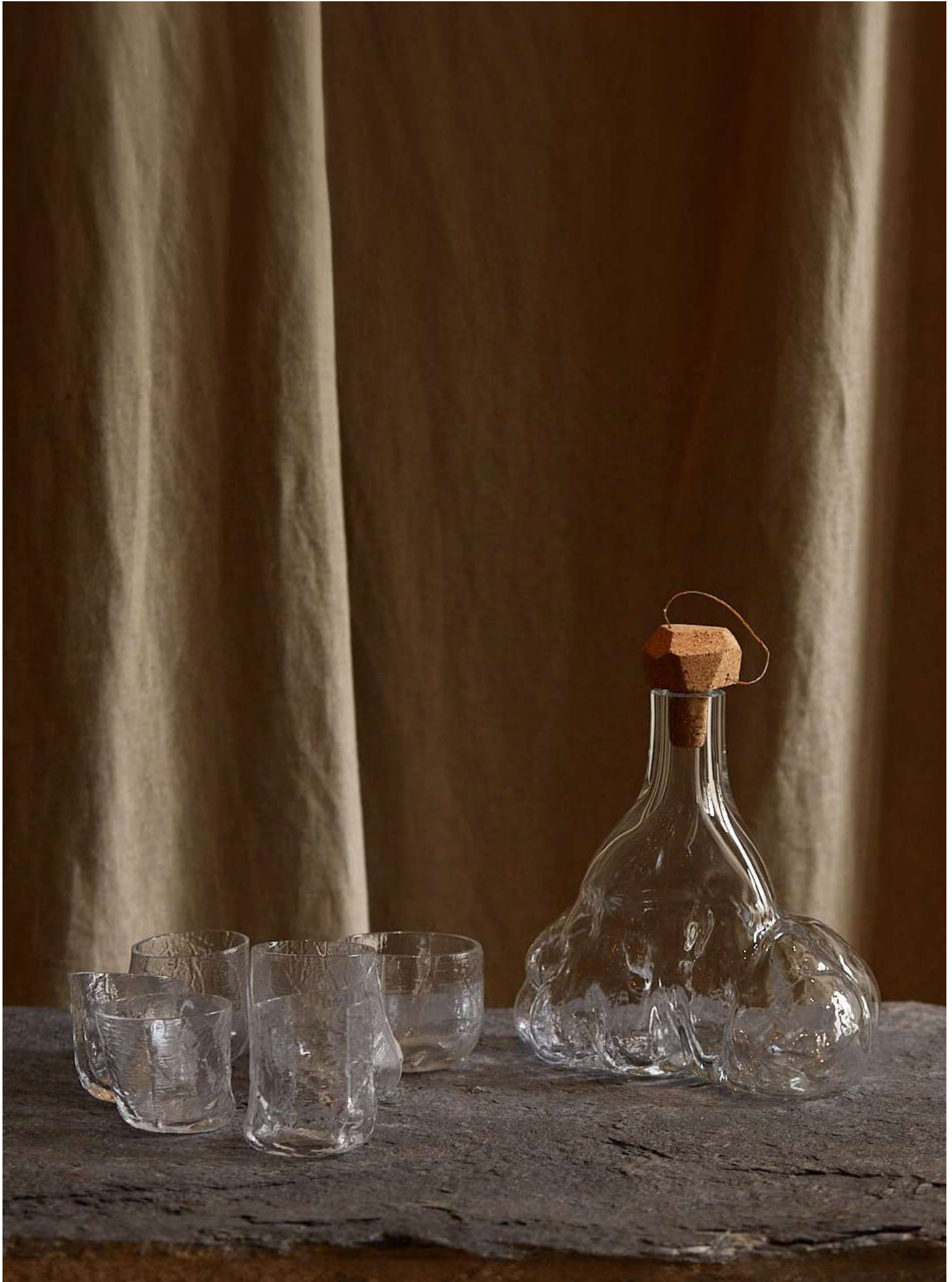
Service/Viscère, galerie l'Œil de KO, 2023, verre soufflé dans moule fait en organes, Dim variable