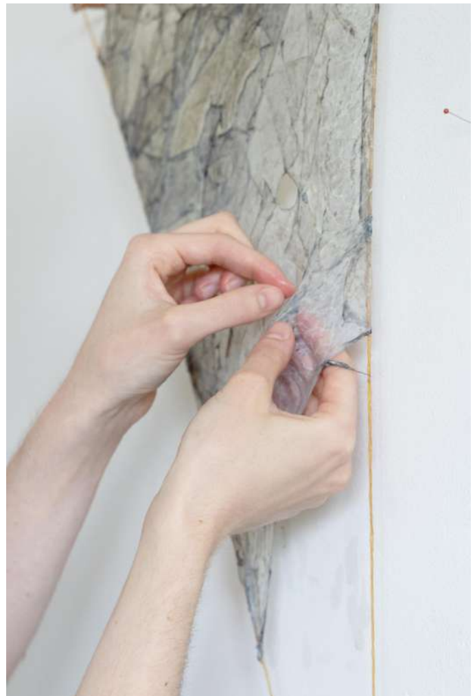
Vue d'atelier