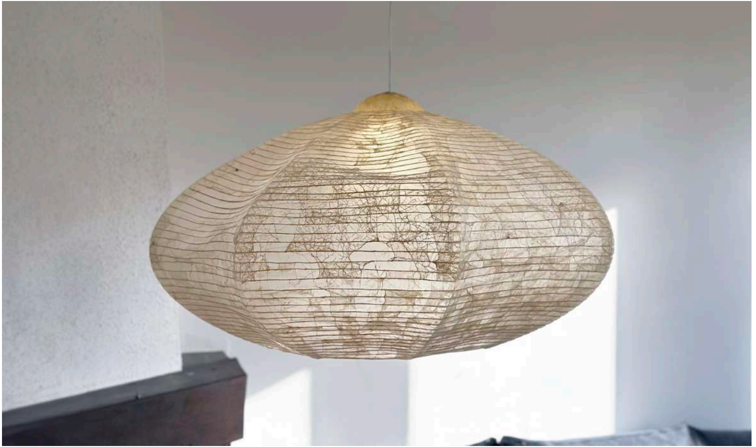
Série sarogu : Holm, client : Holmris B8 for TRÆ, 2024, structure filaire faite d'intestins, chutes de l'industrie agro-alimentaire, encre de seiche, Ø 90 cm, H 45 cm, Ph : Thibault Philip et studio Lendager