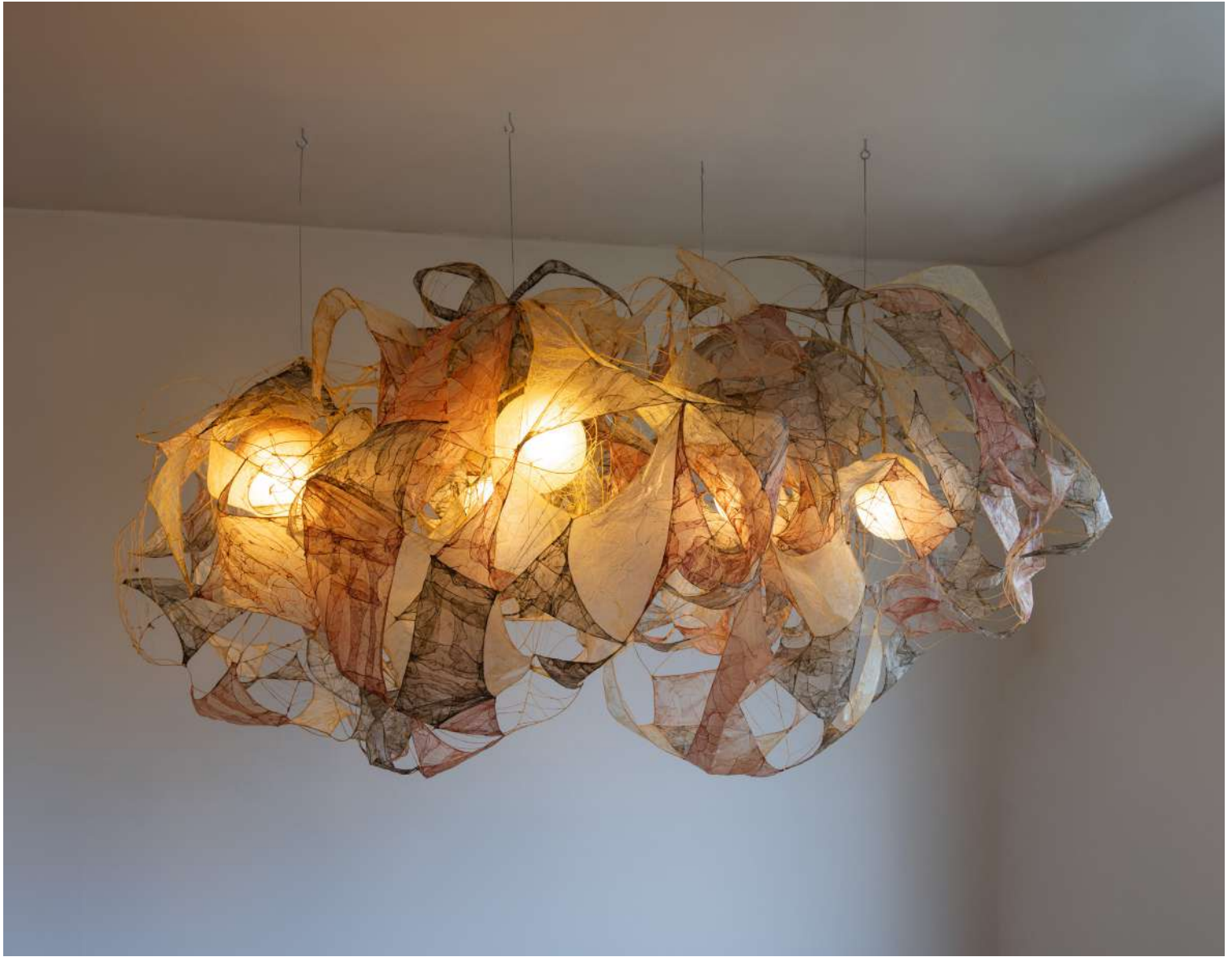
Louvanes, 2025, structure filaire faite d'intestins, chutes de l'industrie agroalimentaire, encre de seiche, racine de garance

Louvanes incarne l'idée de vitrail et de nid biologique, de subtilité et d'étrangeté. Estompant les frontières entre art et design, il est le résultat d'un processus lent et minutieux qui repousse les limites du matériau dans un rapport radical et manifeste. Faisant appel à des connaissances oubliées sur les intestins, à l'instar d'artisanats anciens, ce luminaire met en valeur l'esthétique et la technique d'un matériau hautement évocateur, en lui donnant une nouvelle définition afin d'en changer la perception.