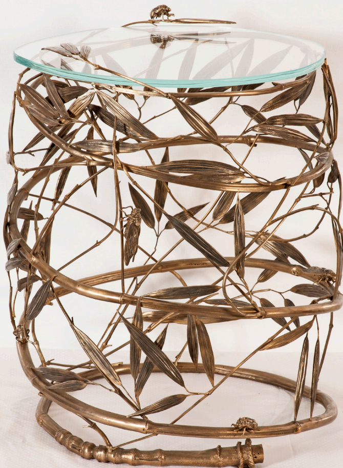
Xiao Fan ru, La voie d'Or

Inauguré en mai dernier, Grand Tour s'est imposé comme un nouvel espace collaboratif inédit dédié à l'art contemporain et au design et propose, tout au long de l'année, des expositions réalisées en partenariat avec des galeries d'art.