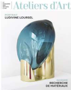
Magazine Ateliers d'Art n°165 Août - septembre 2023