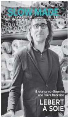
SLOW MADE n°2 Métiers d'art, design et savoir-faire Juillet - septembre 2023