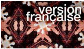
TV5 MONDE, émission «version française» Novembre 2023