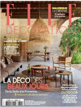
ELLE DECORATION, n°315 Mai 2024 Tendance : « En verre et contre tout »