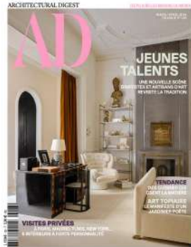
AD Magazine, France n°183 Mars - avril 2024 Jeunes Talents de la nouvelle scène d'artistes et d'artisans d'art.