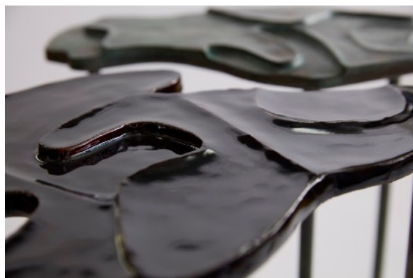
Set de 3 tables d'appoint en grès émaillé, Isabelle Sicart, 2025