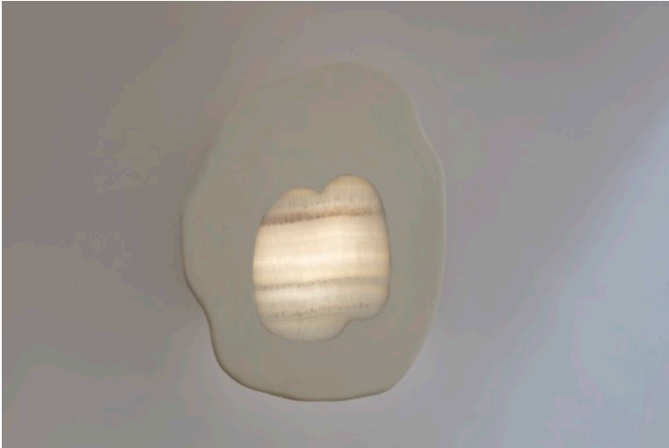
Applique en grès émaillé et onyx, travail collaboratif de Nicolas Reese et Isabelle Sicart, 2025