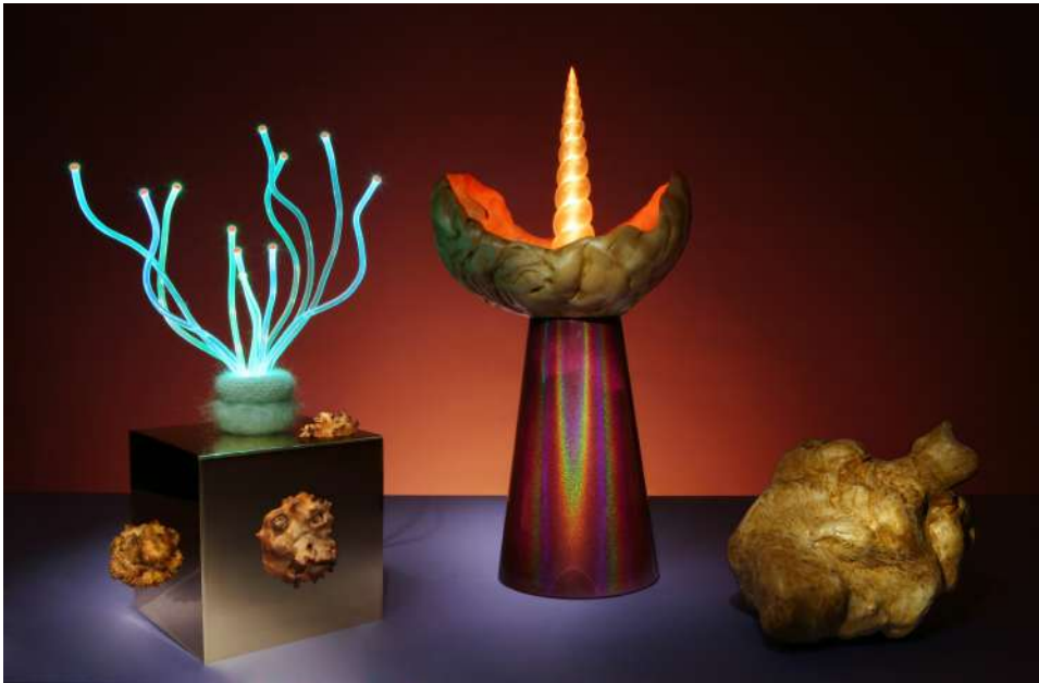
Aia Jüdes, The return of the burls 02 © Aia Jüdes

Aia Jüdes est curatrice et artiste. Son univers est un croisement ludique entre artisanat traditionnel et expressions innovantes. Elle présente des éléments de son projet The Return of the Burls (« Le retour des nœuds »), une série d'objets sculpturaux lumineux basés sur des vrilles - des excroissances qui poussent sur certains arbres et qui, à travers un long processus, sont sculptées, poncées et polies à la main.