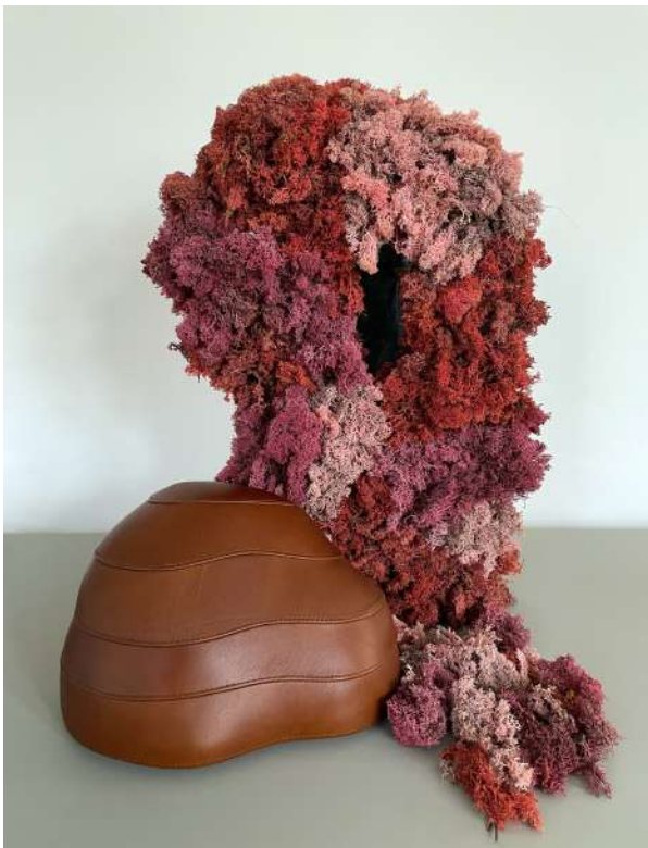
Louise Hederström, Lichen leftover , landscape made by reindeer moss and leather © Louise Hederström and Carina Grefmar

Louise Hederström est designer et travaille souvent avec des matériaux de récupération. Elle a utilisé du lichen provenant d'une entreprise suédoise qui fabrique des absorbeurs de son pour créer des sculptures et œuvres murales en lichen coloré.