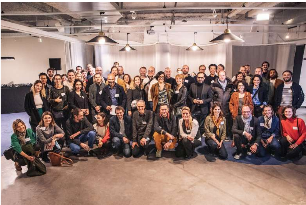
LES INCUBES DU LE FRENCH DESIGN INCUBATEUR

La grande aventure commence là : avec la rencontre avec les clients ! Le FRENCH DESIGN soutient évidemment sur le long terme les projets incubés, par ses réseaux de contacts, de communication, ses expositions en France et à l'étranger. Mais l'incubateur est aussi une communauté qui s'est créée avec des fabricants, éditeurs et designers particulièrement talentueux et prêts à partager leurs expertises, et ce réseau d'entraide est un atout important pour gagner sur un marché mondial très compétitif !