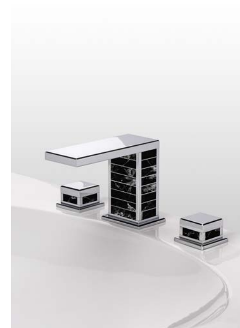
Collection Square - Serdaneli