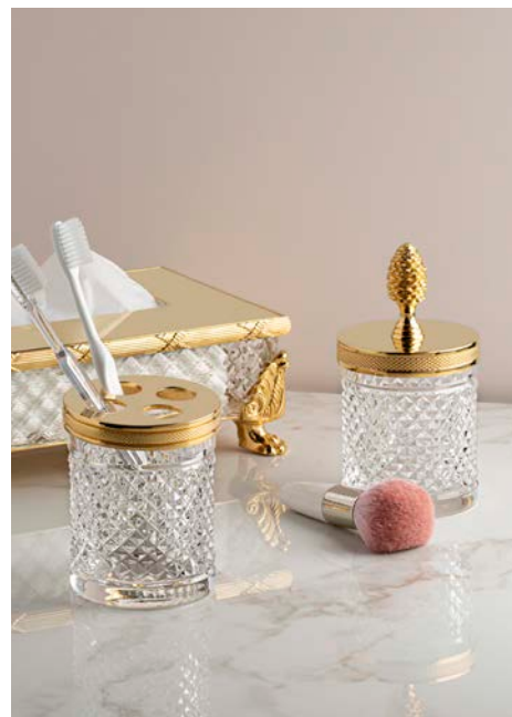
Cristal Diamant ciselé - Cristal&Bronze

Figure incontournable dans l'univers de la salle de bain de luxe, les Maîtres Robinetiers de France s'adressent aussi bien aux professionnels (architectes d'intérieur, décorateurs...) qu'aux particuliers, œuvrant dans l'univers de l'hôtellerie, du retail, du résidentiel ou encore du yachting.