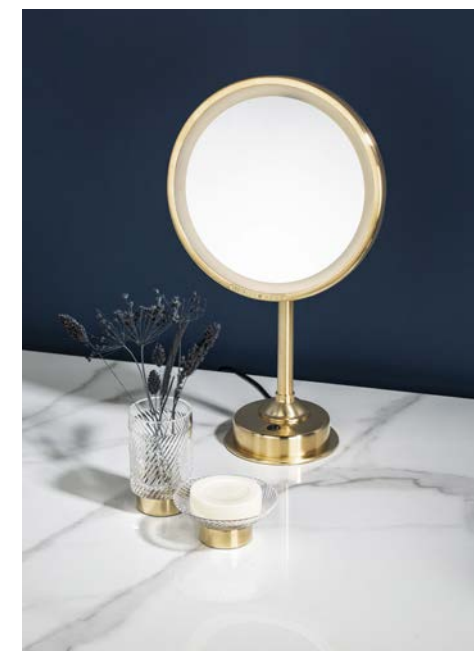
Collection Intemporel - Miroir Brot