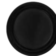
Noir de bronze mat