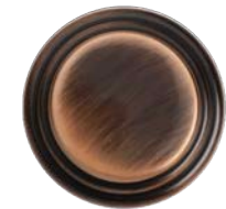
Vieux cuivre brillant