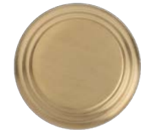
Or pâle mat