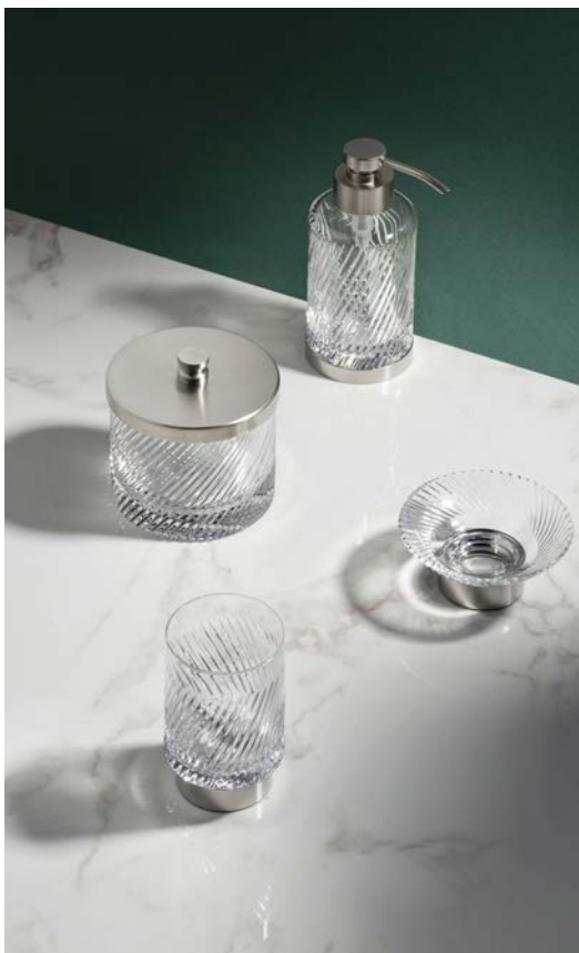
Collection Infini en cristal taillé