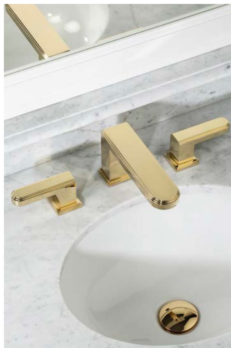
Collection Transatlantique by Martyn Lawrence Bullard