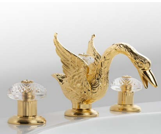
Collection Cygne Ailé