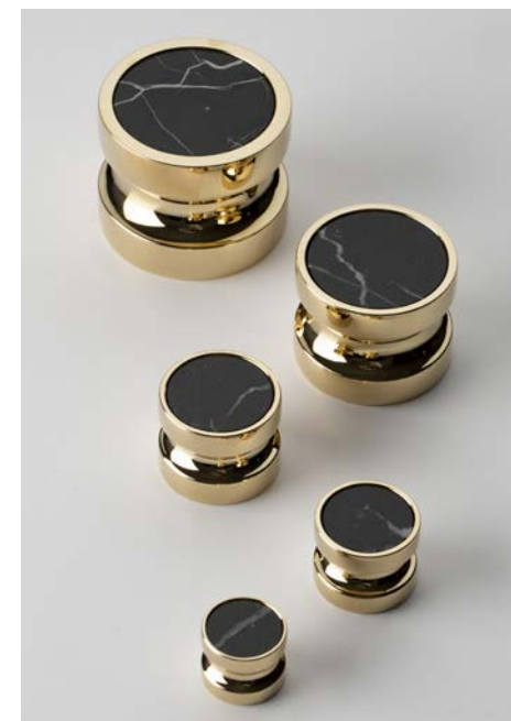
Boutons Néo en marbre Noir Portoro