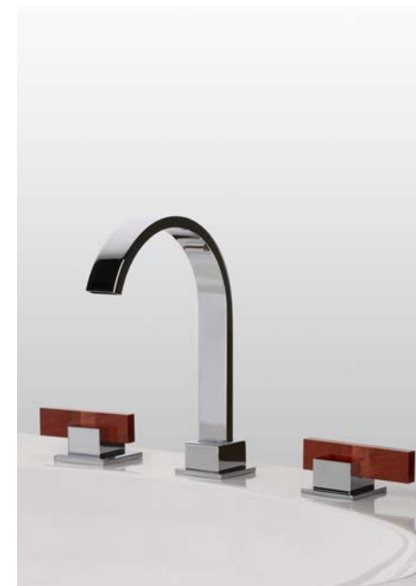
Collection Sky, manettes en jaspe rouge