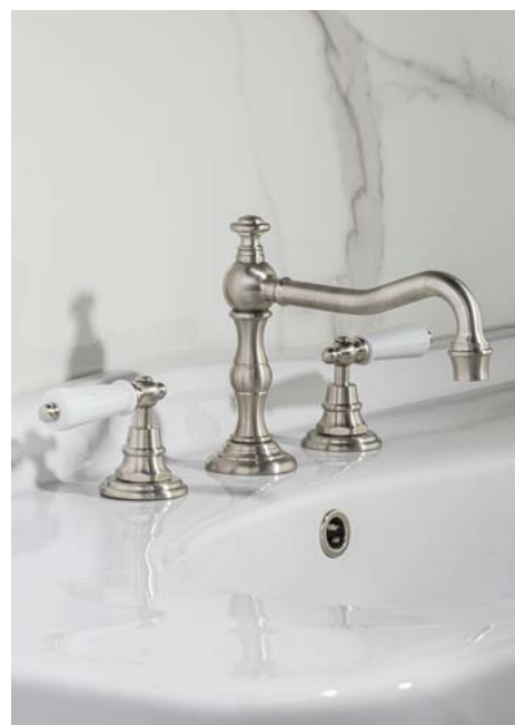
Collection Thétis à manettes - Margot