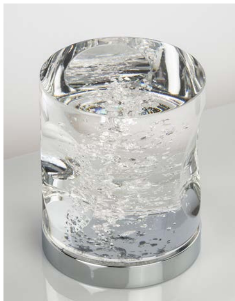
Croisillons en verre soufflé de la Collection Céleste

QUATRE MARQUES SINGULIÈRES ET COMPLÉMENTAIRES