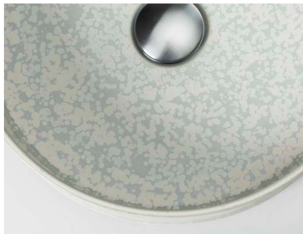
Vasque Serdaneli x Jaune de Chrome

Au fil des années, la marque a acquis une expertise particulière dans l'équipement de yachts. Le Polaris, Dilbar, Lightning... Serdaneli est présente dans les projets les plus incroyables. Plusieurs de ses modèles phares reprennent d'ailleurs les codes esthétiques du yachting, comme les robinetteries « Naja » et « Profile ».