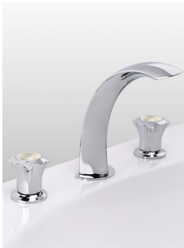
Collection Naja, insertion nacre