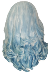
Titre : FEMME INVISIBLE - Je te tourne le dos, 2020 Techniques : Céramique, faïence, peinture à l'huile. Dimensions : 40x30x13 cm