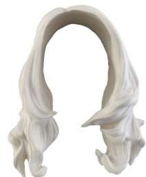
Titre : FEMME INVISIBLE - Regarde moi, 2019 Techniques : Plâtre. Dimensions : 34x28x13 cm Édition ouverte