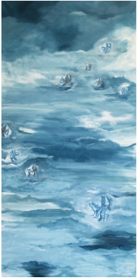
Titre : OISEAUX FANTÔMES, 2021 Techniques : Technique mixte, huile sur coton. Dimensions : 195x96,5 cm