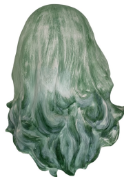
Titre : FEMME INVISIBLE - Je te tourne le dos, 2020 Techniques : Céramique, faïence, peinture à l'huile. Dimensions : 40x30x13 cm