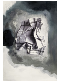
Titre : OISEAU FANTÔME, 2020 Techniques : Technique mixte, huile sur lin. Dimensions : 70x50 cm