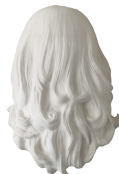
Titre : FEMME INVISIBLE - Je te tourne le dos, 2019 Techniques : Plâtre. Dimensions : 40x30x16 cm Édition ouverte