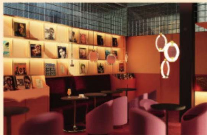
RUPTURE , 11, rue du Verbein, Paris-3 e . Du mardi au vendredi de 14h à 19h, le samedi de 12h à 20h. rupture.store