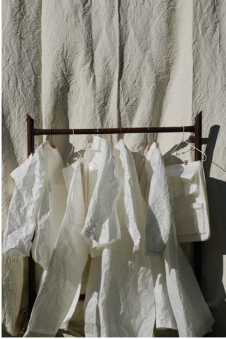
Les vêtements de travail, 2020, papier. Jeanne Tresvaux du Fraval , diplômée de l'École des Arts Décoratifs de Paris en 2020, secteur Image imprimée.