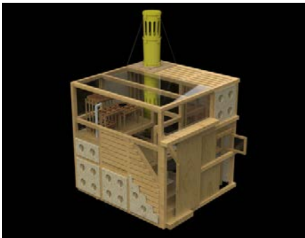
Xochi, serre expérimentale, expérimentation d'une aquaponie, 2020. Paul Lossent , diplômé de l'École des Arts Décoratifs de Paris en 2018 secteur Design objet.