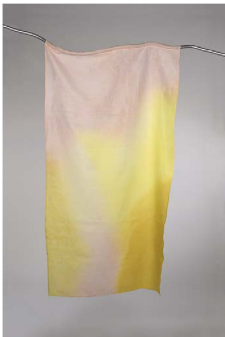
Gradient aurore , 2020, rideau en toile de lin colorants naturels imprimés par pulvérisation. Lou Ramage , diplômée de l'École des Arts Décoratifs de Paris en 2020, secteur Design textile et matière.