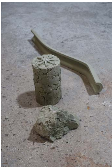
Terre brut et extrusion en terre du Grand Paris , 2020, argile verte de Bagnolet issu d'un chantier de construction. Simon Chaouat & Souleimen Midouni , diplômés de l'École des Arts Décoratifs de Paris en 2020, secteur Design objet.