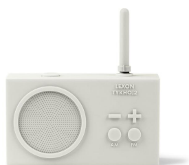
Lexon, radio Tykho, qui a fêté ses 20 ans en 2018