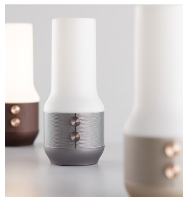
Lexon, lampe et enceinte connectée Terrace