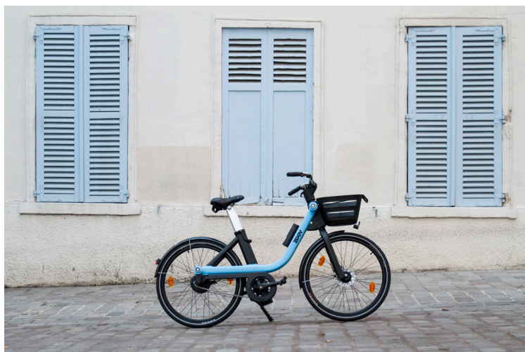
Vélo Zoov