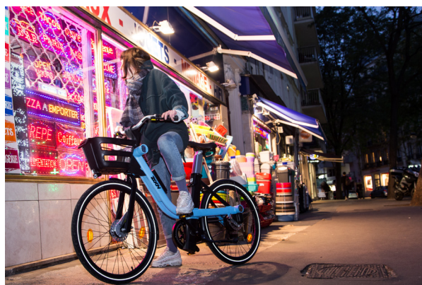
Vélo Zoov