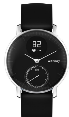
Montre connectée Steel HR pour la société française Withings