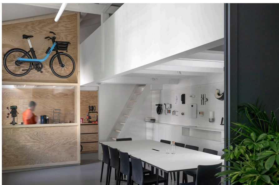
Agence elium, salle de réunion showroom et atelier