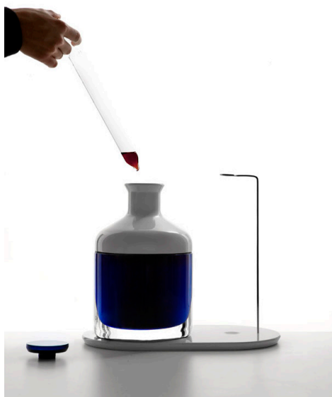
Antic Biotec, vinaigrier dont le design allie les codes de l'oenologie et du laboratoire