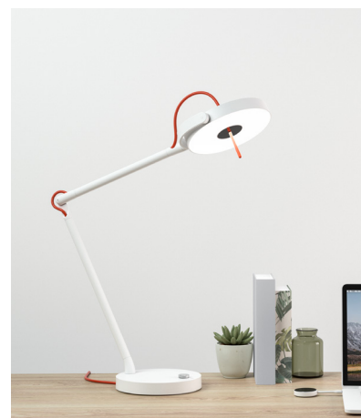
Oledcomm, MyLifi, lampe permettant de se connecter à internet par la lumière