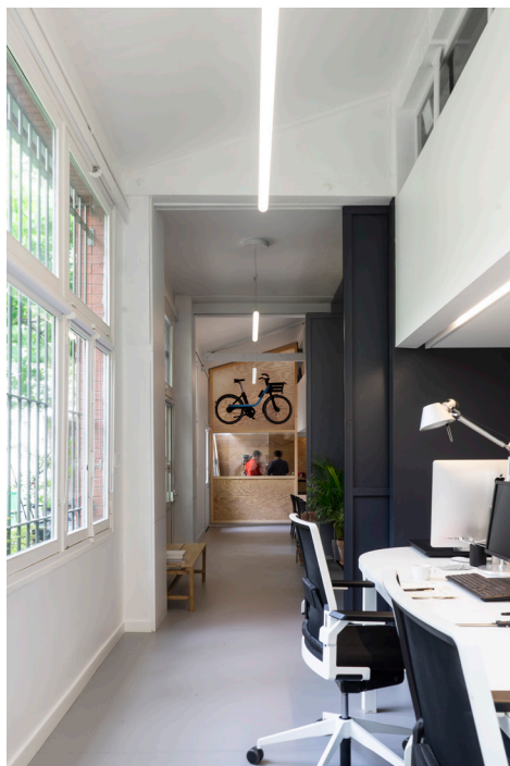
Agence elium, espaces de travail

Ce vélo et son service associé seront présentés chez elium pendant la Paris Design Week.