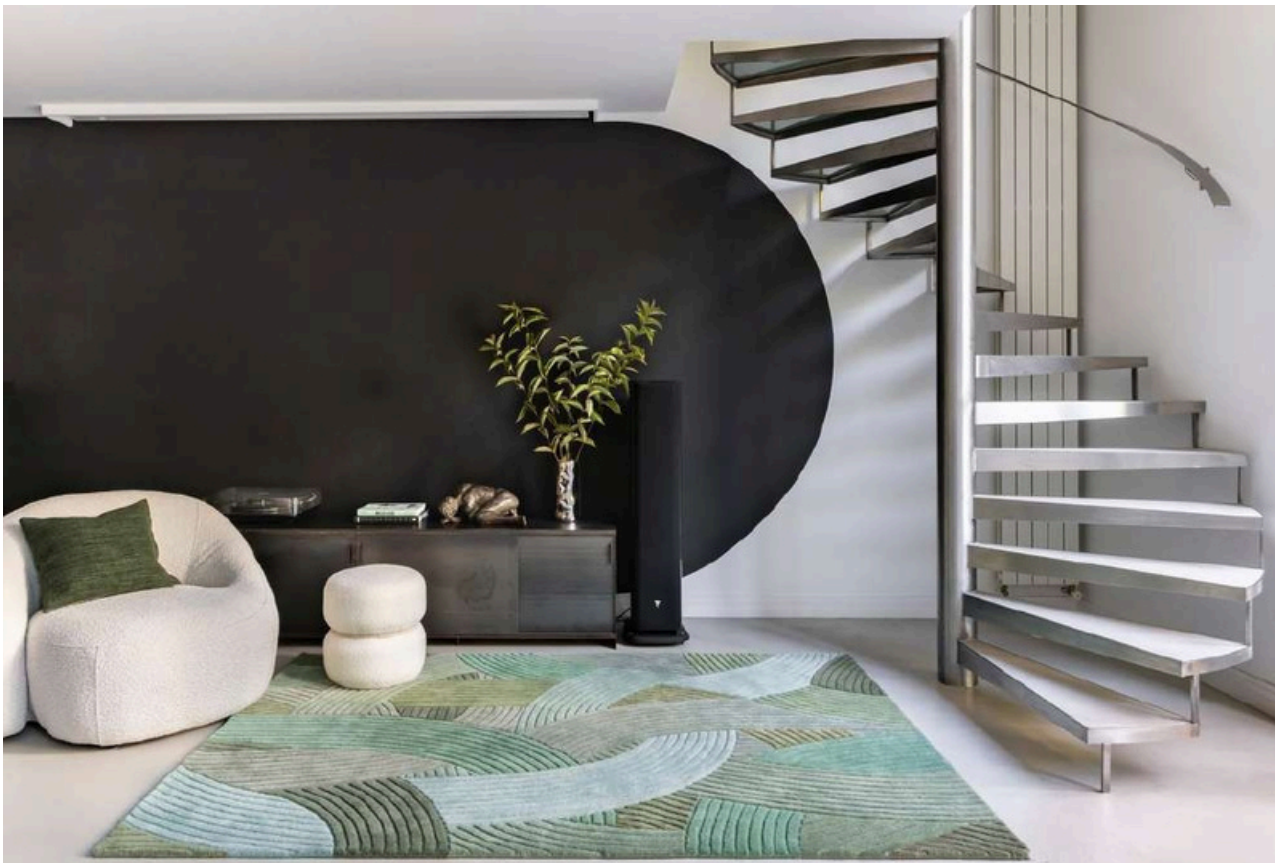
Tapis Canopée de Samuel Accoceberry

Particularité : Idéal pour les couloirs et les espaces longs, il s'adapte aux dimensions souhaitées grâce à son format sur-mesure.