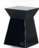
Presse-papier laque Nagato

Liaigre enrichit jour après jour son catalogue de mobilier et de luminaires avec une nouvelle collection d'accessoires.