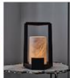
Lanterne Laguna, wengé et verre soufflé