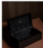
Boîte à clés teck noirci