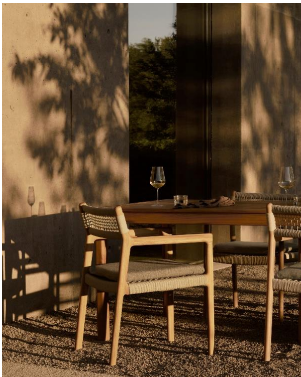
Chaise de jardin Jack Woven

La collection Outdoor 2026 dévoile des nouveautés au sein de l'offre extérieure grandissante d'Ethnicraft, allant de nouveaux modèles audacieux à des extensions soigneusement pensées. Le premier canapé d'extérieur modulable de la marque, Monocle , offre le confort d'un meuble d'intérieur tout en étant conçu pour la vie en plein air. Avec son caractère élégant et entièrement modulable, il s'adapte à chaque espace. La nouvelle Safari lounge chair introduit une esthétique inspirée du vintage, dotée d'un coussin interchangeable dans la teinte Dune .