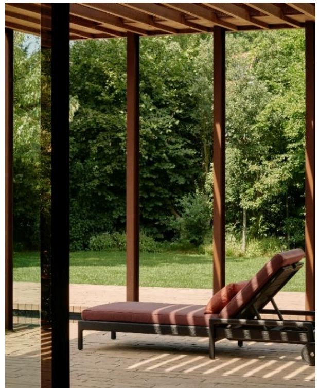
Chaise longue de jardin ajustable Jack- Burgundy