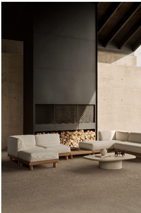
Canapé modulaire de jardin Monocle

Anvers, 12 Janvier 2026, Belgique — Ethnicraft dévoile avec fierté sa collection Outdoor 2026, présentée à travers la campagne évocatrice Under Belgian Skies . Cette collection rend hommage aux origines de la marque et à l'héritage belge : une célébration de l'authenticité, du savoir-faire artisanal et de la beauté de la vie quotidienne en plein air. Plutôt que de s'envoler vers des horizons lointains et ensoleillés, Ethnicraft a choisi de tourner son regard vers l'intérieur, capturant la richesse subtile d'un véritable été belge