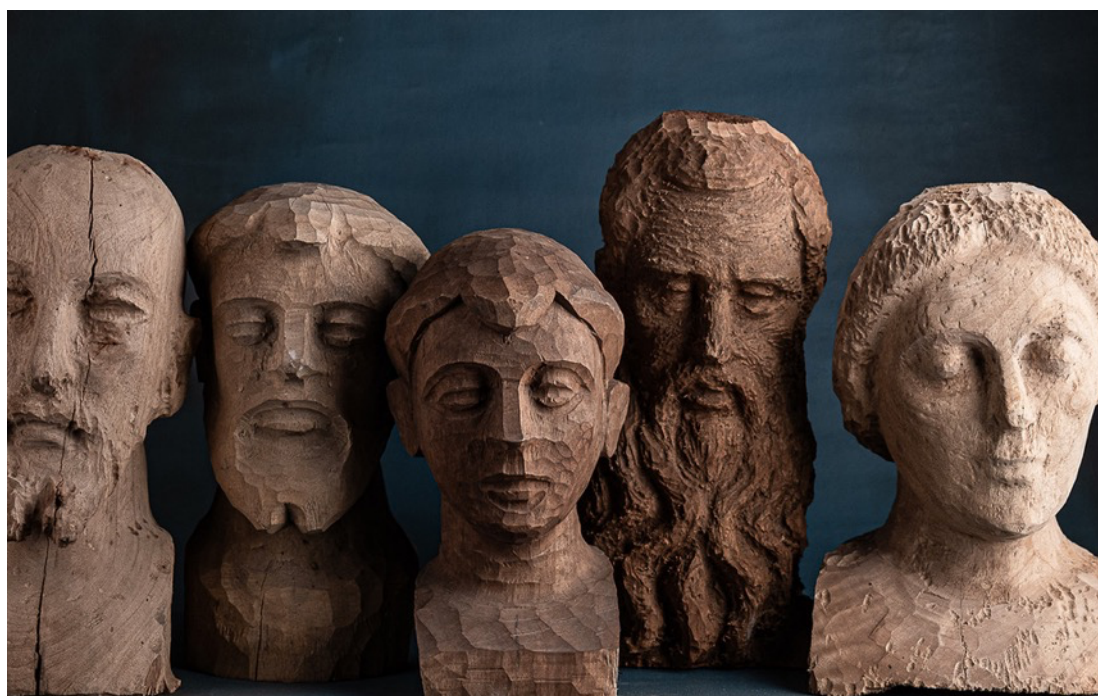
Les saints comme source d'inspiration pour les nouvelles têtes de Klatt Objects (de gauche à droite) : Saint Joseph, Pio, Saint Antoine, Moïse et Agnès

Force, tranquillité, contemplation, espoir. Chaque buste raconte sa propre histoire. Cette histoire est dans l'œil de celui qui la regarde. Au total, six nouveaux personnages viendront enrichir la collection Klatt Objects ce printemps.