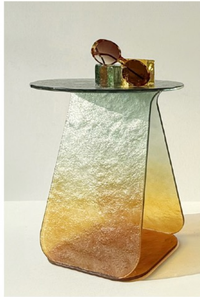
Glass collection Table YOUMY