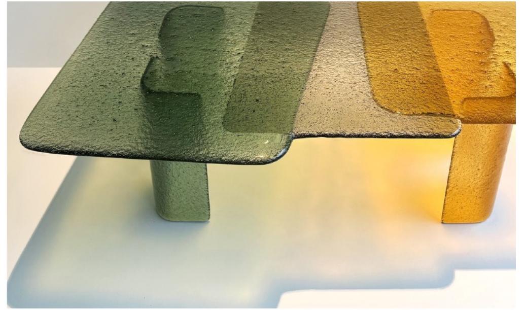
Glass collection Table COLOR PLAY