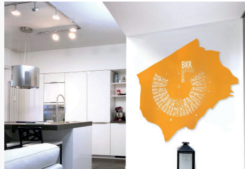
La carte peut être placée sur le mur ou encadrée

1 Nous recevons les dimensions ou images de l'espace dans lequel insérer la carte.