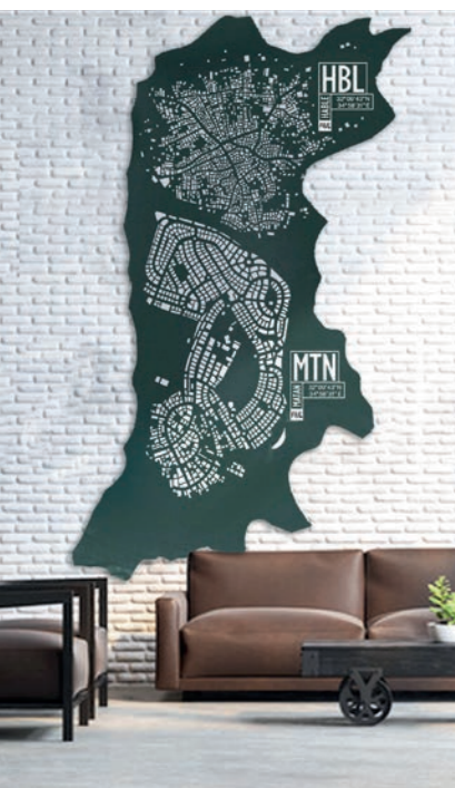
32°04'43"N 34°58'31"E HABLE MATAN - Palestine Israéli

Hable et Matan, deux villes géographiquement jumelles, l'une israélienne et l'autre palestinienne. C'est peut-être visuellement l'exemple le plus explicite de deux villes si différentes mais si proches qu'elles sont presque un unicum, s'il n'y avait pas la frontière entre Israël et la Palestine qui les divise, en les séparant violemment en deux par un mur. Pourtant, leur beauté réside dans leur symbiose et leur diversité désespérée.