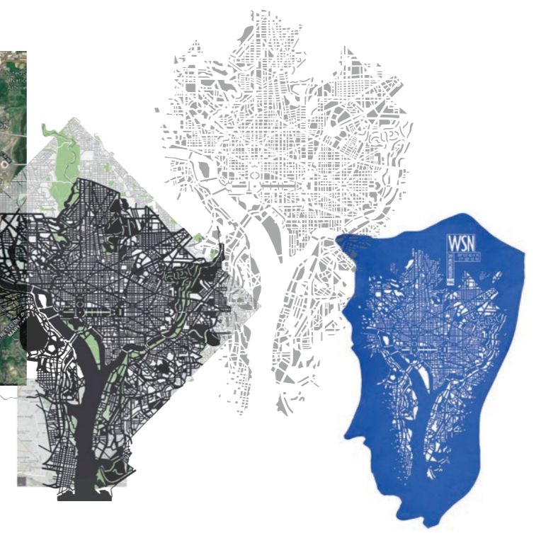
Washington D.C - USA