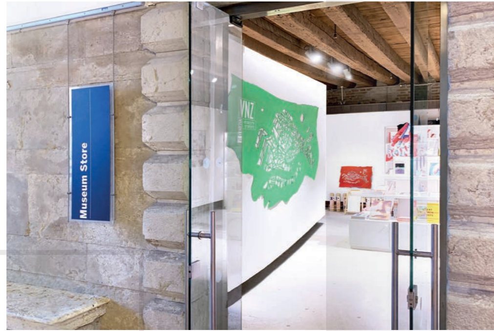
CA' PESARO Galleria Internazionale d'Arte Moderna Venice