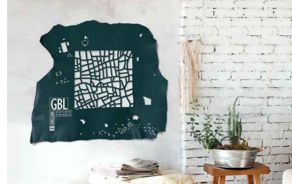
37°47'17.09"N 12°58'16.62"E CRETTO DI BURRI - Gibellina Vecchia, Sicile - Italie