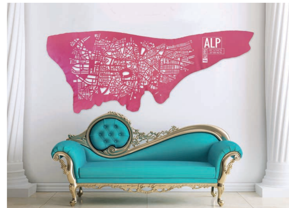
36°12'04"N 37°09'40"E ALEPPO - Syrie