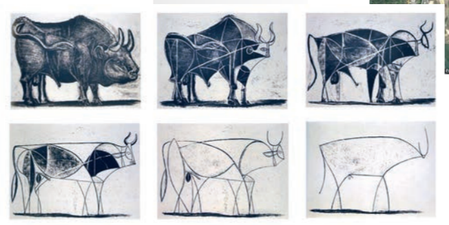
Pablo Picasso, El Toro, 1945