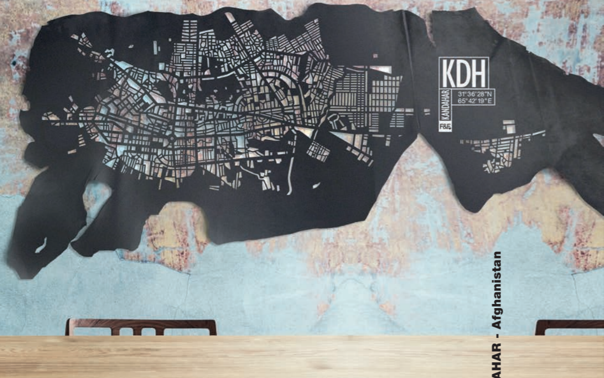
31°36'28"N 65°42'19"E KANDAHAR - Afghanistan