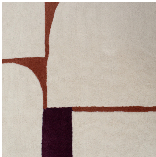
Tapis BINIBECA 160 x 230 cm | Prix : 795€ 200 x 290 cm | Prix : 998€