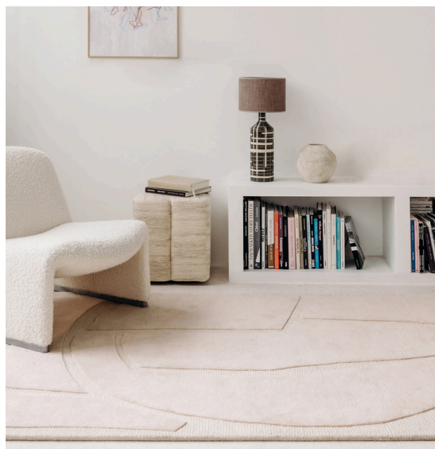
Tapis SAIL 160 x 230 cm | Prix : 795€ 200 x 290 cm | Prix : 998€