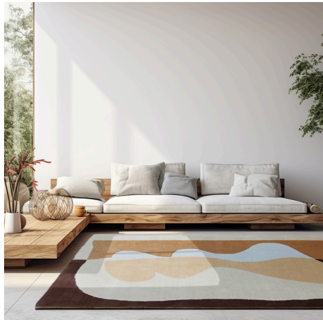
Tapis NARCISSE 160 x 230 cm | Prix : 795€ 200 x 290 cm | Prix : 998€