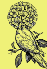
Les Billets doux,

l'accessoire de décoration chic & graphique