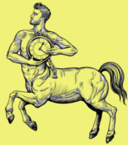
Les Accessoires : pour des ventes additionnelles