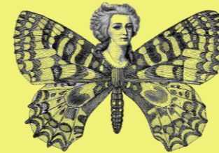
Les Bougies Piliers,

Le cadeau plein d'esprit pour des dîners plus légers