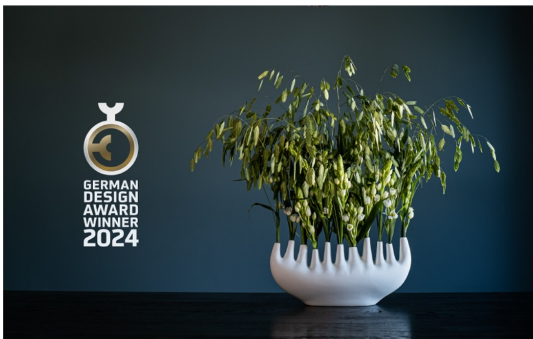
„Winner“ de German Design Award 2024: Vase Rhizom de Klatt Objects