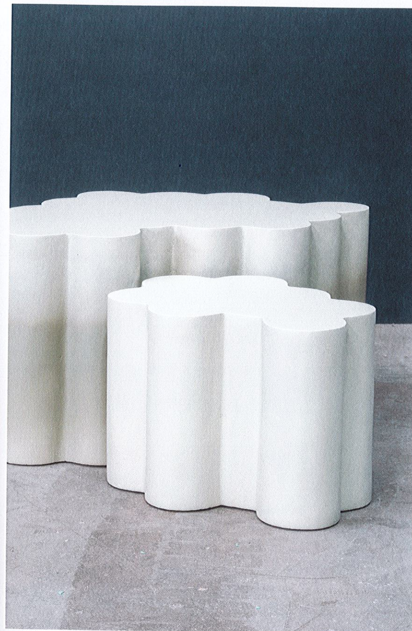
• Ci-dessus: Tables gigognes Lithos • STUDIO COGITECH

Ce goût du mélange nous habite encore, si bien que nous nous passionnons toujours pour d'autres techniques. Prenez un luthier par exemple: la façon dont celui-ci va coller le bois pour fabriquer ses violons peut nous inspirer et nous permettre de développer une méthode que nous appliquerons alors à un autre matériau. »