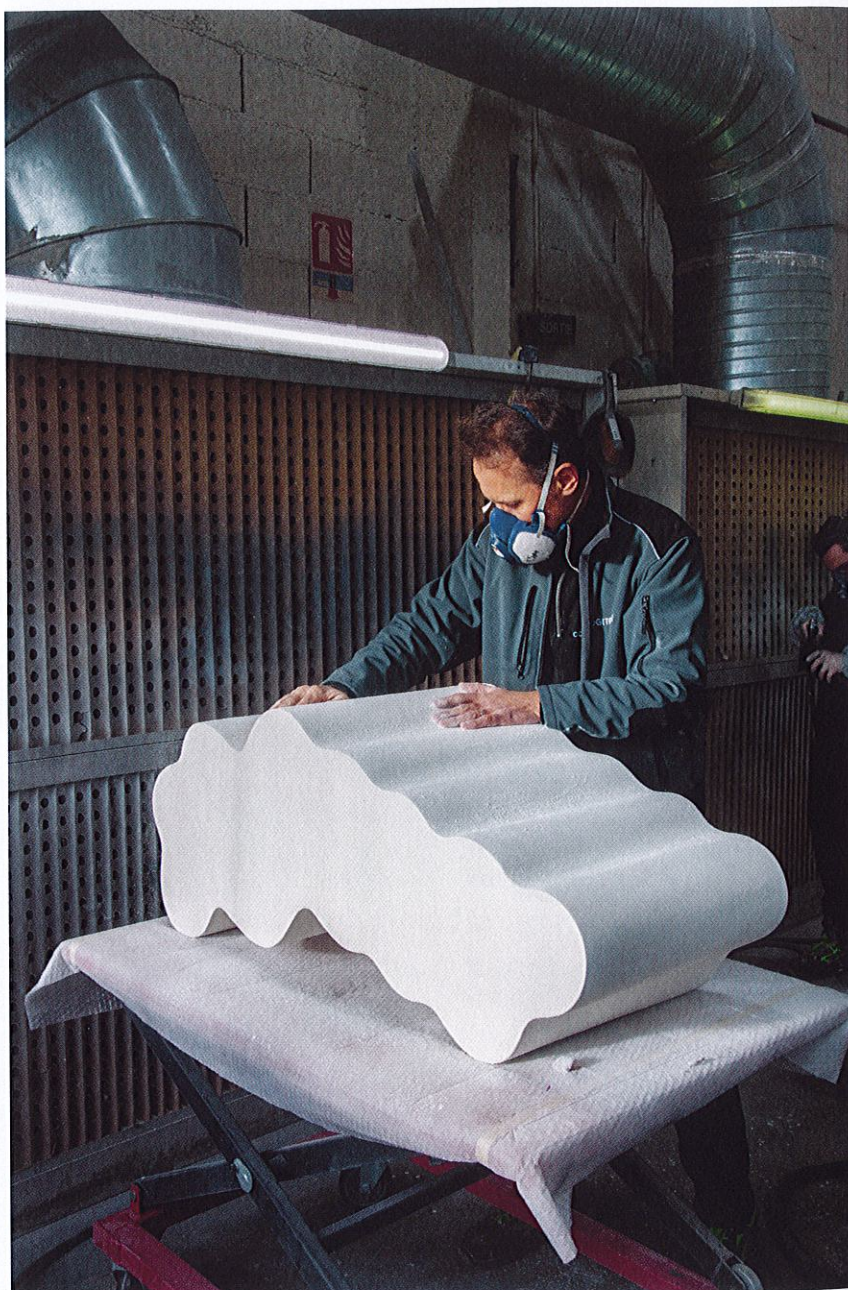
• Ci-dessus: Tables gigognes, atelier • STUDIO COGITECH

Une conviction qui s'accompagne d'un penchant prononcé pour les expérimentations, parmi lesquelles le détournement de pratiques traditionnelles appliquées à d'autres champs d'action. « Mon associé et moi-même venons de l'industrie, poursuit l'entrepreneur. Notre premier savoir-faire, ce sont les matériaux composites qui, par définition, sont un mélange de plusieurs éléments.