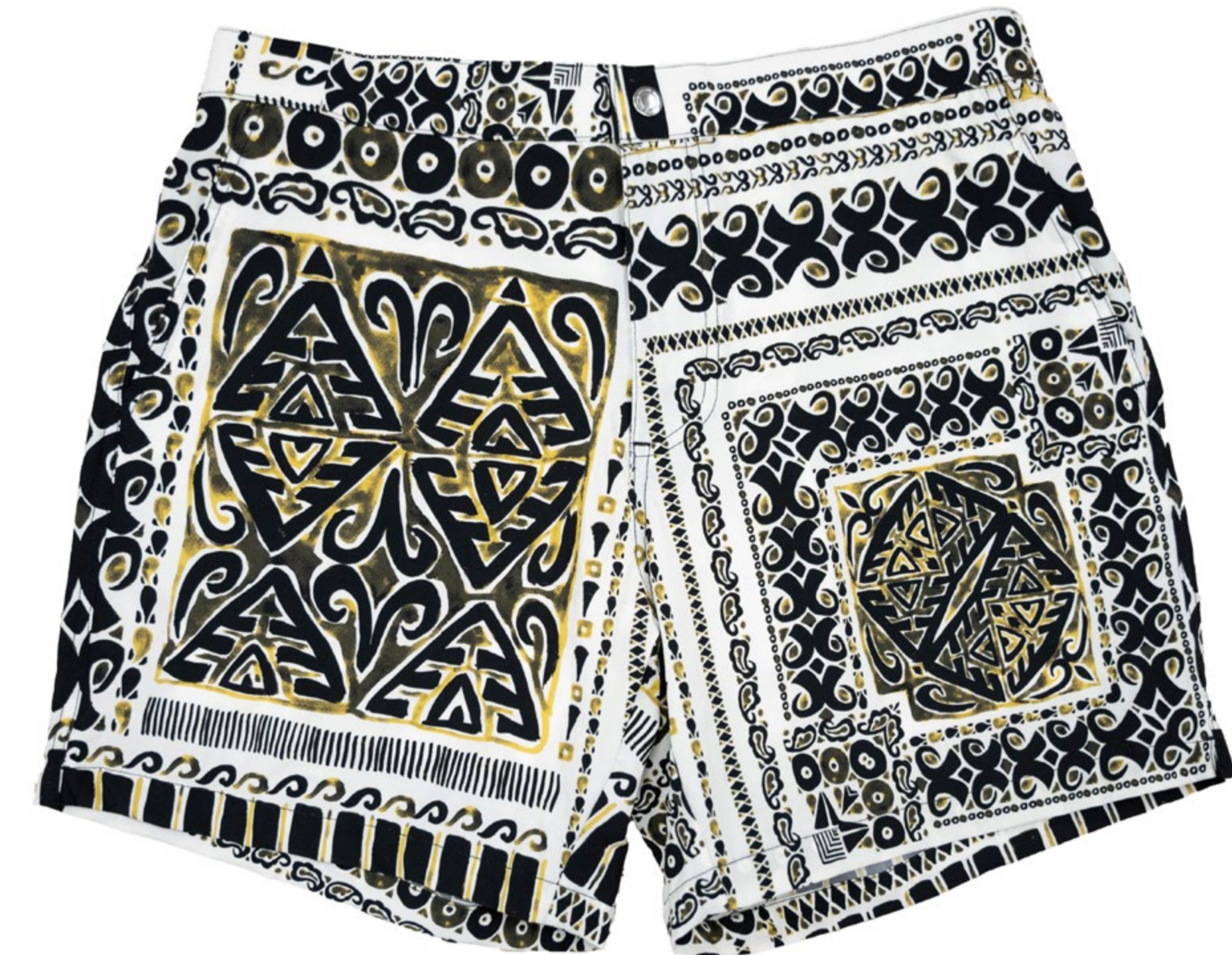
GINO imprimé kaki