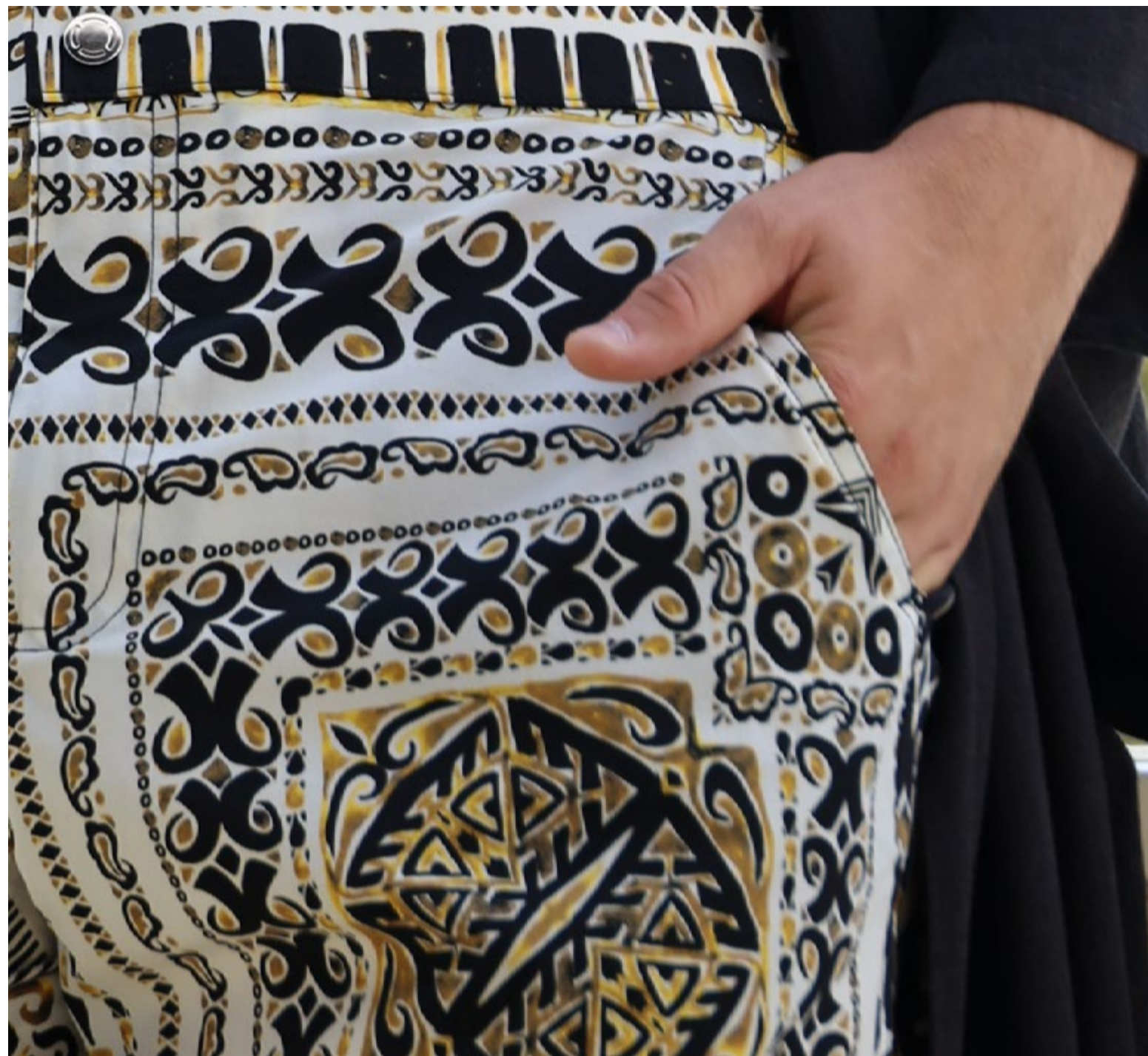
Deux poches latérales