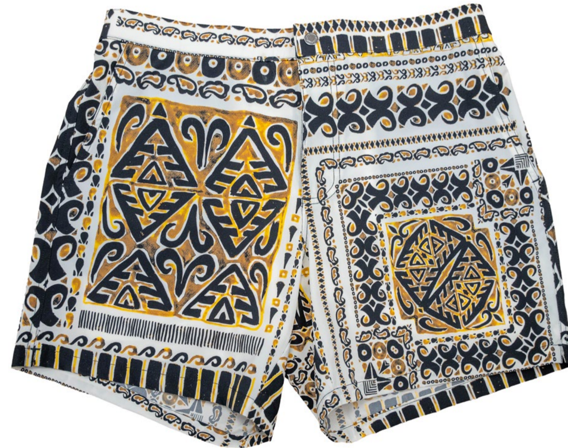
GINO imprimé jaune