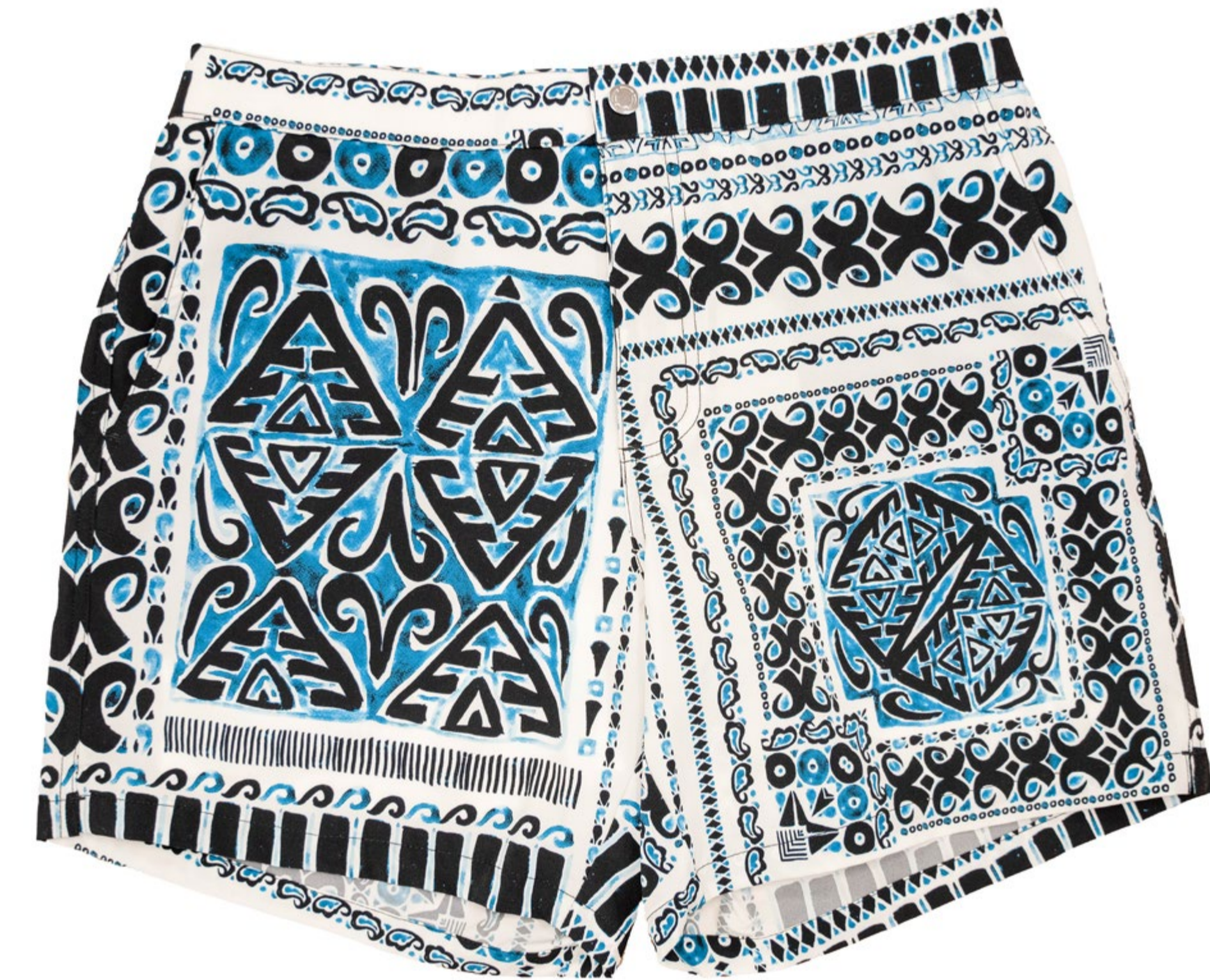
GINO imprimé bleu