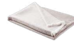
TOUNDRRA Plaid 004506 Naturel - Massala 130 x 170 cm Laine de mouton et viscose - Népal 250 € TTC