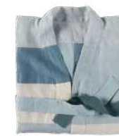
KATSURA Kimono Mosaïque 004455 Bleu 131 x 115 cm Lin lavé - Vietnam 250 € TTC

Katsura, étonnant kimono: avec lui, l'aventure commence! On s'envole vers la villa impériale de Katsura (Japon), à la découverte des fameux damiers bleus de ses parois coulissantes. On imagine les brodeuses de la baie d'Halong qui ont assemblé 57 pièces différentes pour fabriquer ce kimono, revisitant la technique du patchwork coréen, le pojagi. On voyage dans les nuances subtiles de l'indigo: bleu océan, vert d'eau... Dans une composition aquarellée qui adoucit l'hiver.