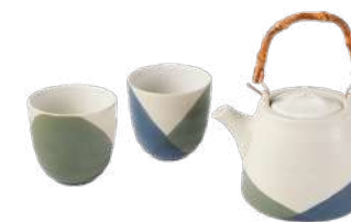
OOLONG Coffret théière + 2 gobelets 004475 Ivoire Bleu D11 H10 cm Grès, bambou et cuivre - Chine 79 € TTC