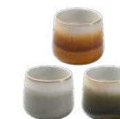
CHAWAN Gobelets 004476 Ambre - Bronze - Gris D9 H8 cm Grès - Chine 15 € TTC