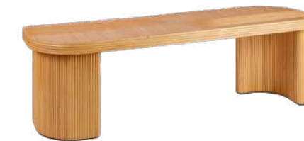
WABI Banc 004453 Naturel 140 x 40 H46 cm Bois et rotin - Indonésie 790 € TTC