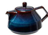
MIRA Théière 004474 Bleu Pourpre D17,5 H14 cm Porcelaine - Chine 79 € TTC