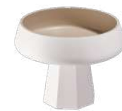
ÉPOPÉE Plateau sur pied 003997 Sable Blanc 21 x 21 H16 cm Bois laqué - Vietnam 170 € TTC