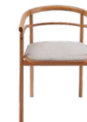
KODAMA Chaise 004481 Naturel 56 x 51,5 H77 cm Chêne massif avec inserts en noyer et tissu - Vietnam 695 € TTC