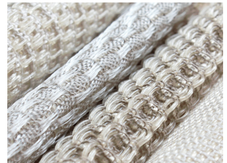
Gélotextile ® Rose Ekwé