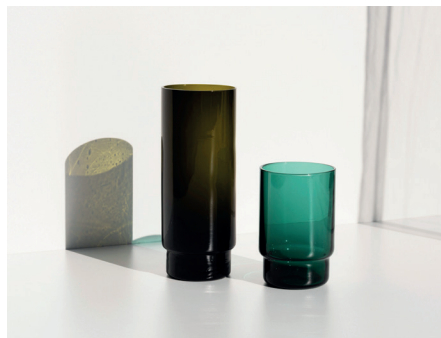
Collection Pot Atelier Lucile Viaud