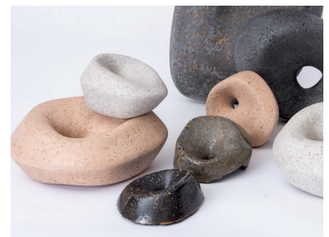
Collection Matière Papier Cogitech