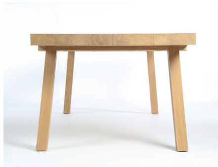
Table Bâti Lisa Dartus & Tom Bussat