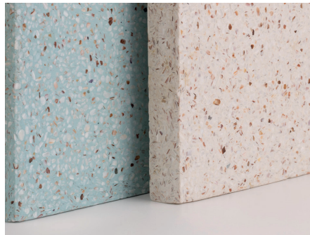
Terrazzo Marin Ostrea