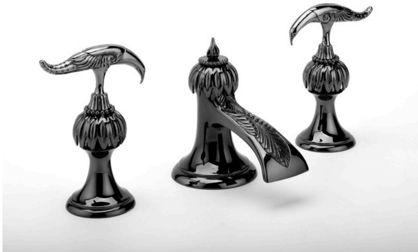
Série limitée Oiseaux de Paradis - Mélangeur lavabo 3 trous sur plan et bec finition canon de fusil