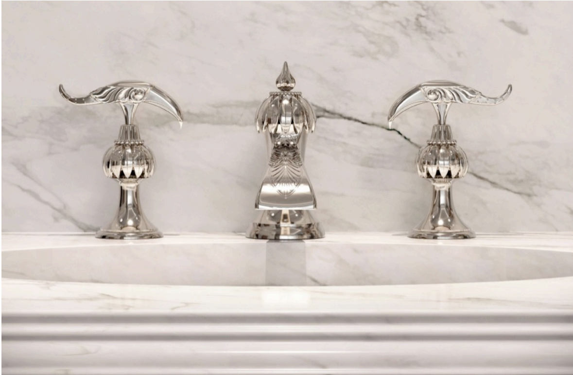
Série limitée Oiseaux de Paradis - Mélangeur lavabo 3 trous sur plan et bec finition nickel brillant