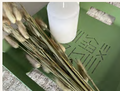
Voyage et Accessoires