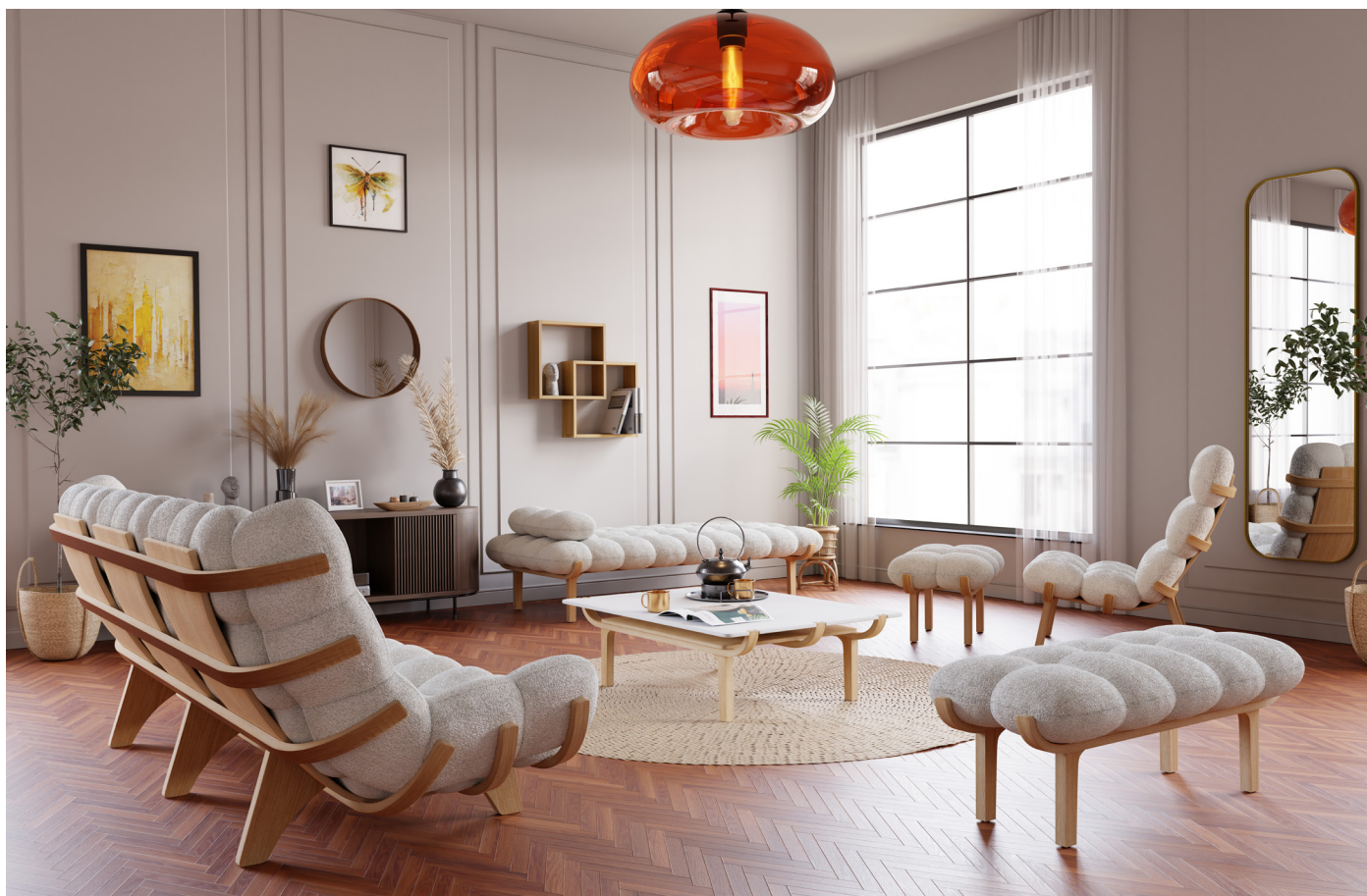
Ensemble gamme Nuage, bois finition chêne, tissu laine bouclette blanc