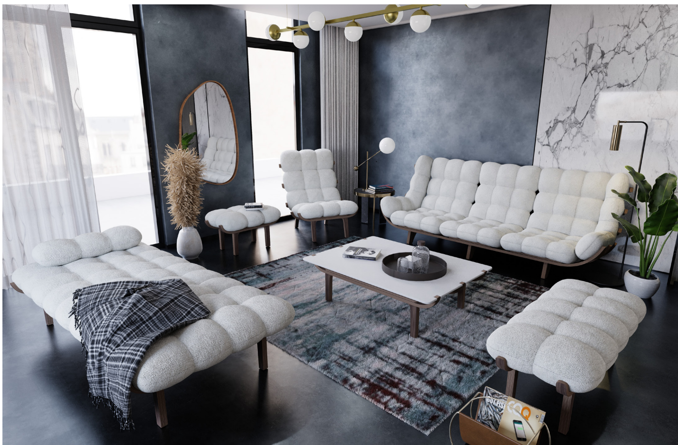
Ensemble gamme Nuage, bois finition noyer, tissu laine bouclette blanc