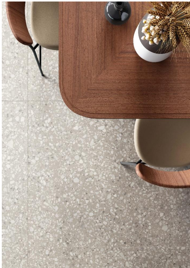
Revêtement de sol : Le Ville Badoer

Cette symphonie harmonieuse de fragments de différentes tailles est mise en valeur par les répétitions aléatoires et les surfaces continues qui composent un motif enrichi de formes précieuses sur lesquelles la lumière se reflète. Cela offre de magnifiques effets de clair-obscur et des atmosphères raréfiées au charme inédit et intemporel.