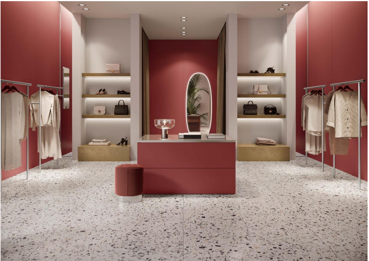
Revêtement de sol : Le Ville Pisani - Revêtement mural : Atelier Rubino