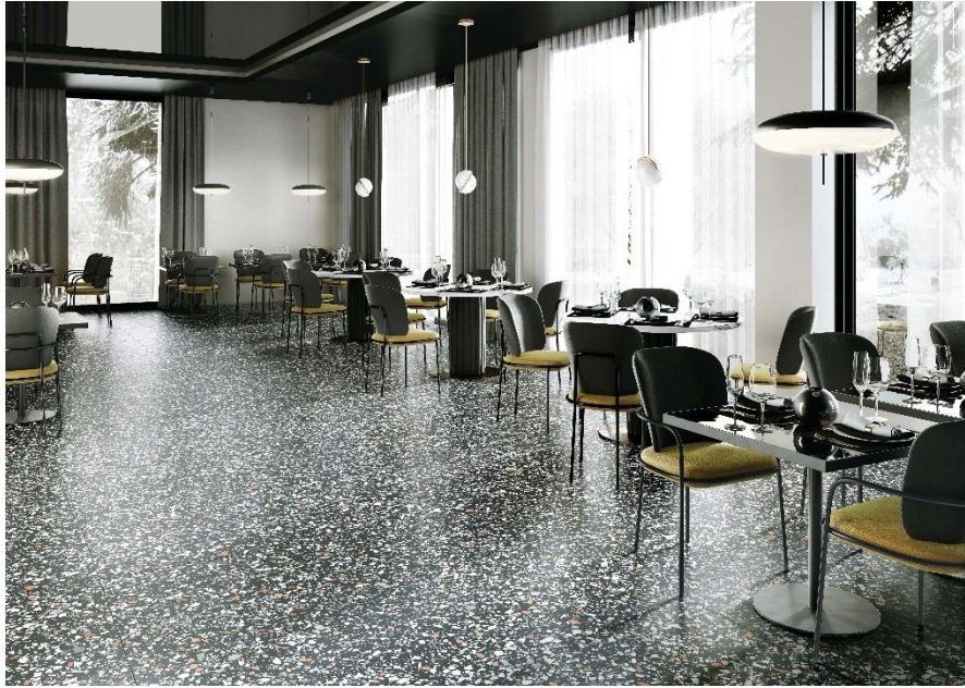
Revêtement de sol : Le Ville Barbaro

Le Ville se prête à la création de solutions conceptuelles modernes et à d'intéressants jeux de pose, également en association avec les autres collections de Casalgrande Padana, en particulier avec la nouvelle série Atelier .