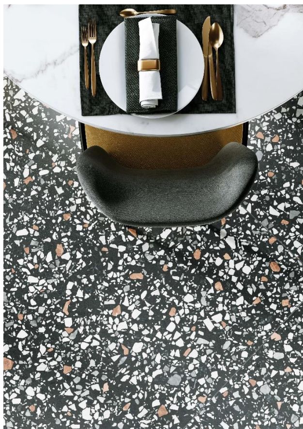
Revêtement de sol : Le Ville Barbaro

Cet éloge de la beauté où le caractère ancien et artisanal de la grenaille s'allie aux excellentes performances techniques du grès cérame donne vie à la liberté de création la plus totale. Le grès de Casalgrande Padana est en effet un matériau écodurable , entièrement recyclable, anallergique , antibactérien (grâce à la technologie Bios Antibacterial ® disponible sur demande), ignifuge, imperméable, résistant à la flexion, solide et inaltérable dans toute condition climatique et facile à poser et à nettoyer.