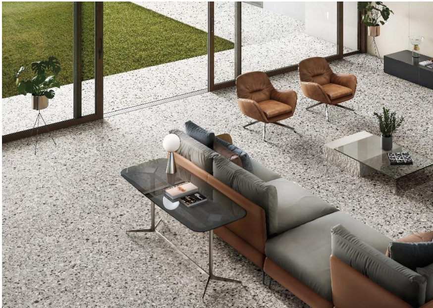
Revêtement de sol intérieur et extérieur : Le Ville Foscari