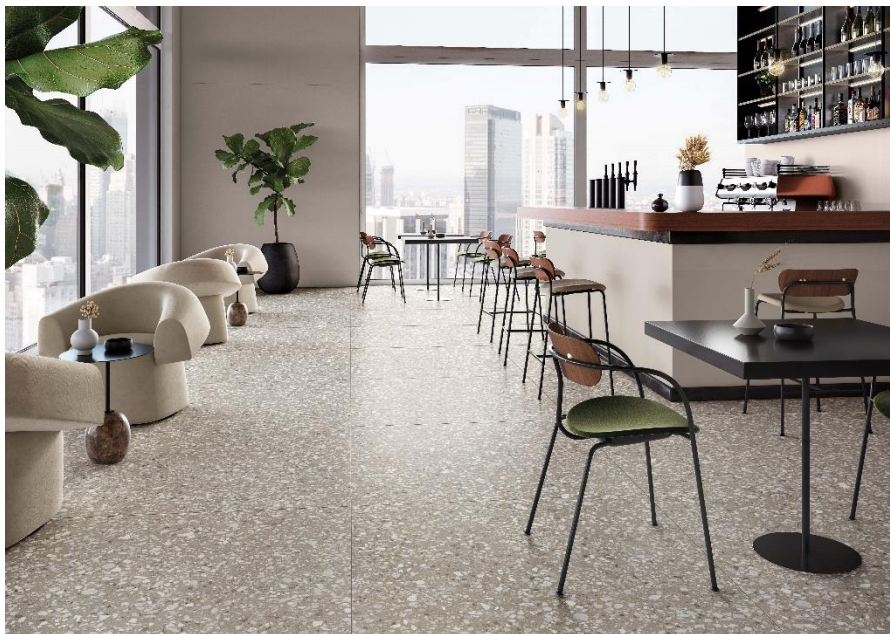
Revêtement de sol : Le Ville Badoer

Cette collection est idéale pour revêtir de grandes surfaces comme les sols des hôtels, des restaurants et des boutiques de tout type, mais aussi pour décorer avec style et personnalité tout espace de la maison. Équarris et rectifiés, grâce à la planéité parfaite et au grand format 120x120 cm, les carreaux en grès de la nouvelle collection effet terrazzo permettent de donner naissance à des tapis à pose continue avec des joints réduits au minimum et de concevoir ainsi des espaces élégants et contemporains.