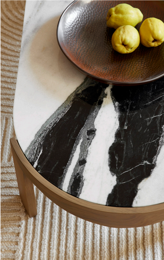
Table basse Hinoki La force des matières