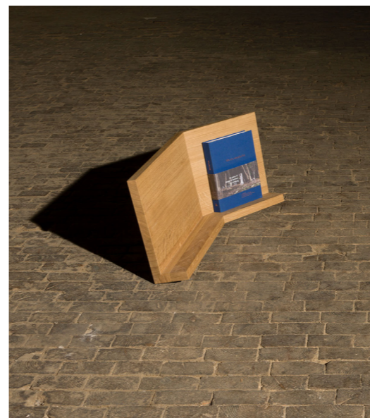
↑ Folded shelf Porte-revues et porte-livres Ce meuble existe en version gauche ou droite. Chêne L82,5 cm x W36 cm x H36cm Prix sur demande