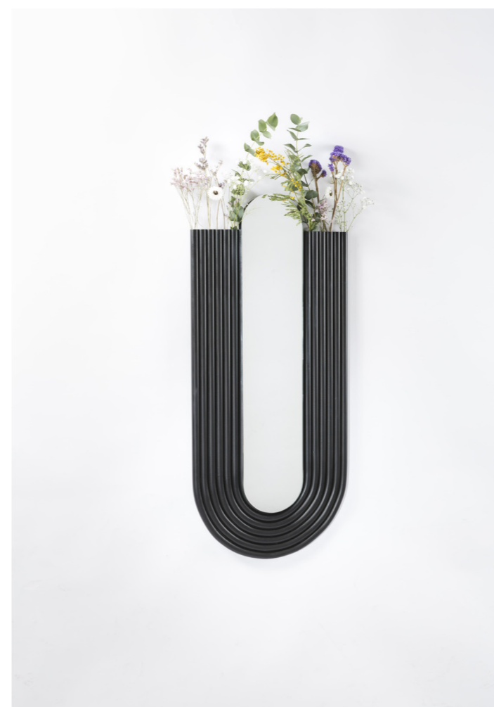
← Monade Ensemble de miroirs Aluminium Deux tailles: 930cm x 420cm | 1470cm x 560cm Prix public : 2000€ / 2500€