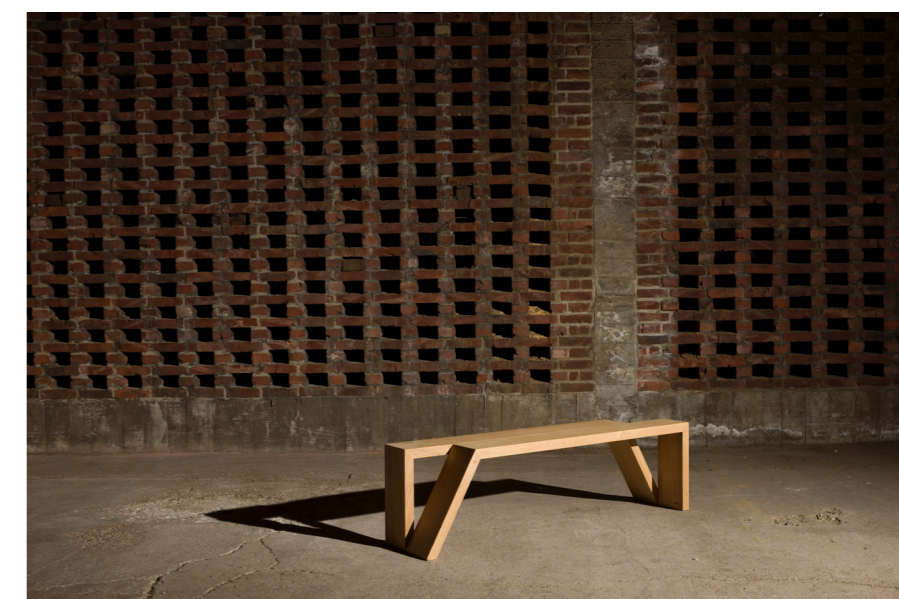
↑ Folded bench Banc combinable avec un siège ou une table basse, utilisable comme banc ou table d'appoint. Disponible en version longue ou courte, gauche ou droite. Chêne L100 x W32 x H40cm L140 x W32 x H40cm Prix sur demande