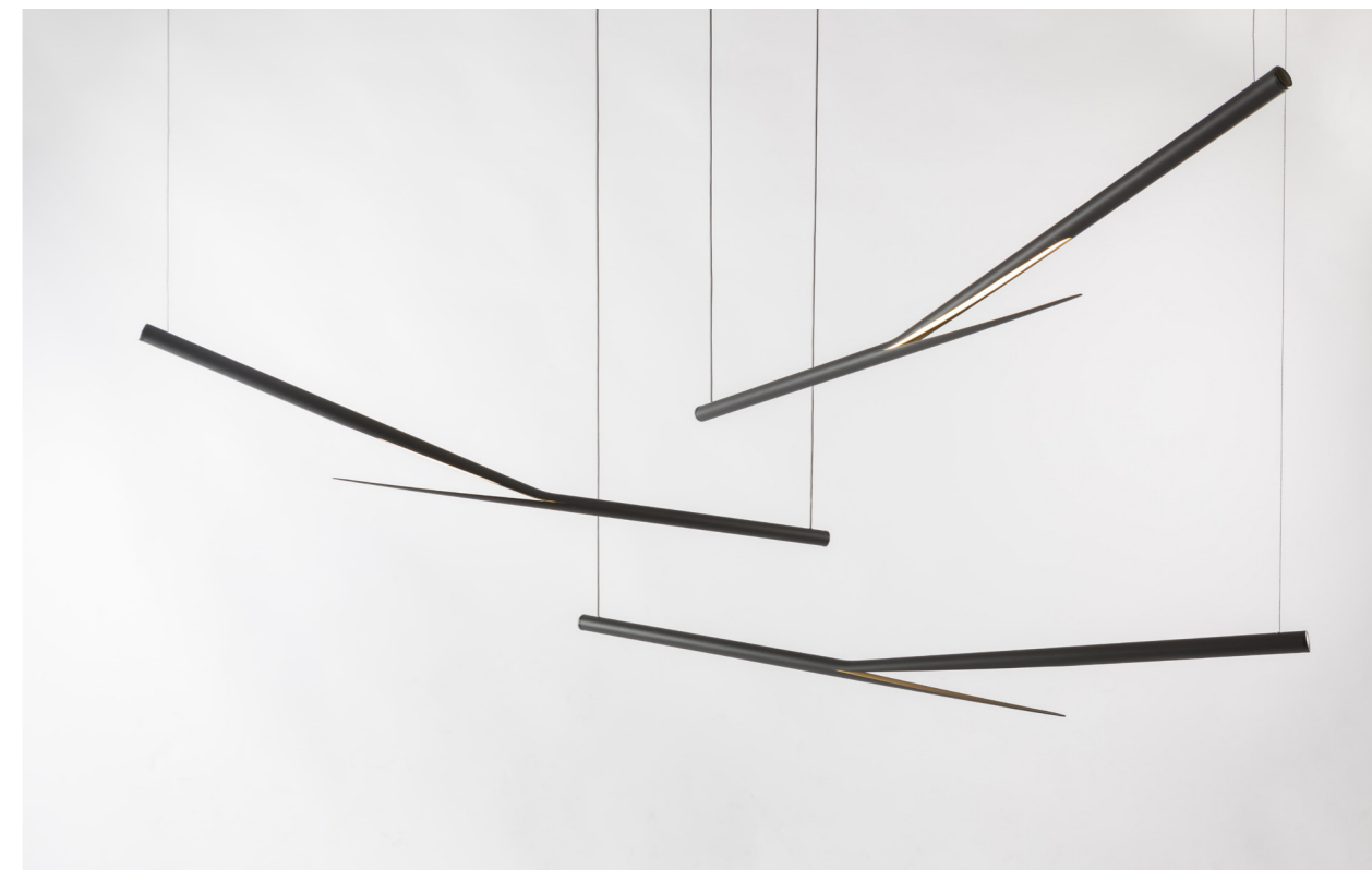
↑ Prémisse Suspension lumineuse Aluminium et LED 1200 cm Prix public : 850€ (simple) à 1600€ (ensemble)