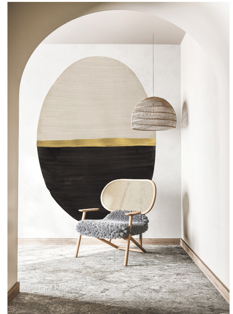
→ Signature Tome II Papiers peints en fibre non tissée Disponibles en rouleaux, en tailles standard ou sur mesure Prix public : à pd 60€/m 2