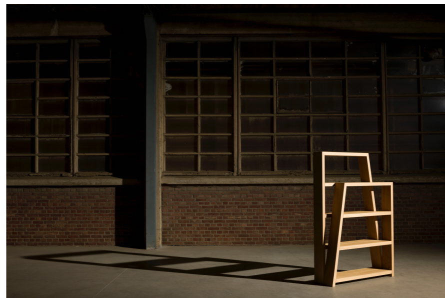
→ Folded rack Version augmentée du bench & rack, avec quatre étagères. Existe en version haute ou basse, gauche ou droite. Chêne L110 x W32 x H160cm Prix sur demande