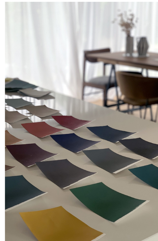
↑ Carte de teinte en collaboration Tenue de Ville x Peintagone Disponibles en 1L, 5L et 20L en différentes finitions Prix sur demande