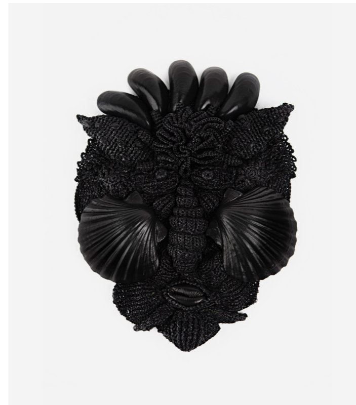
← Fatu huku Masque en raphia avec coquillages gainés de cuir recyclé. Raphia et cuir 30cm x 25cm Prix public : 940€