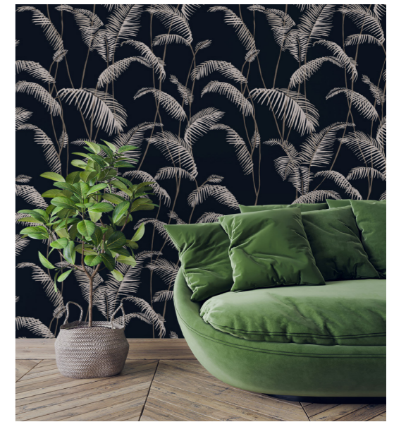
↑ Signature Tome I Papiers peints en fibre non tissée Disponibles en rouleaux, en tailles standard ou sur mesure Prix public : à pd 60€/m 2