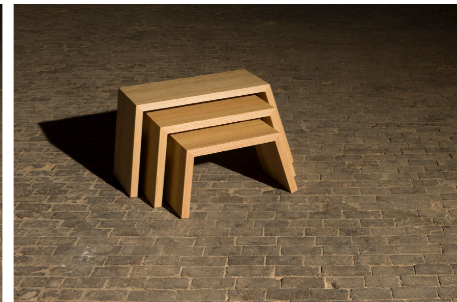
↓ Folded side Tables gigognes. Chêne L76,5 x W28 x H40cm Prix sur demande