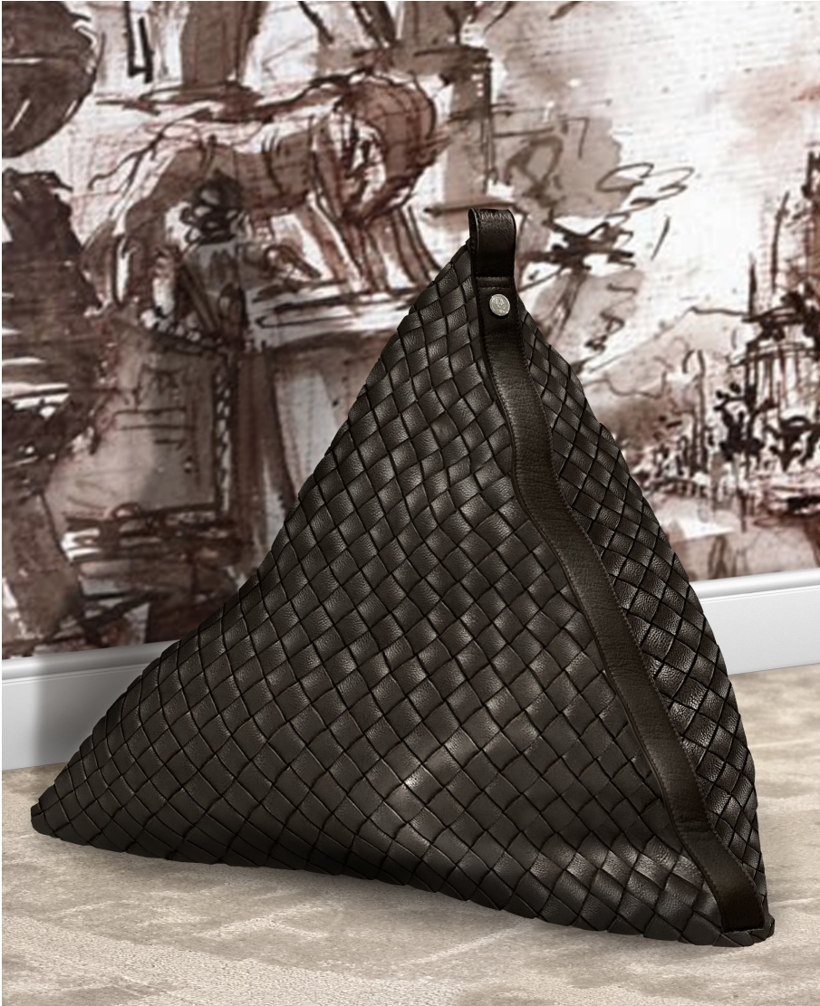
Berlingot design Duvivier Canapés R&D. Cuir pleine fleur tressé.

PARIS 8-17 #PDW22 SEPT. 2022 DESIGN WEEK