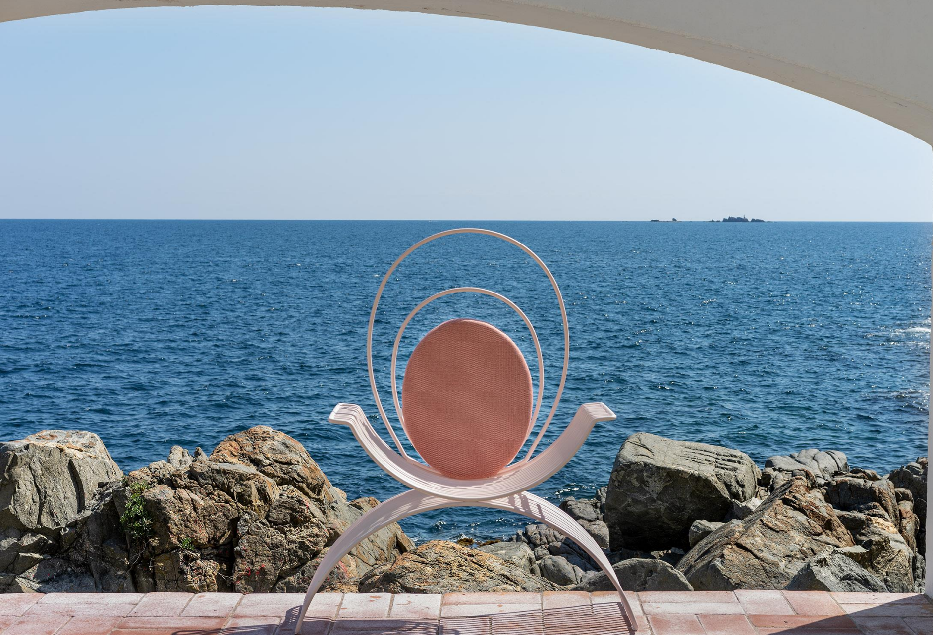
NEW ROMANA throne