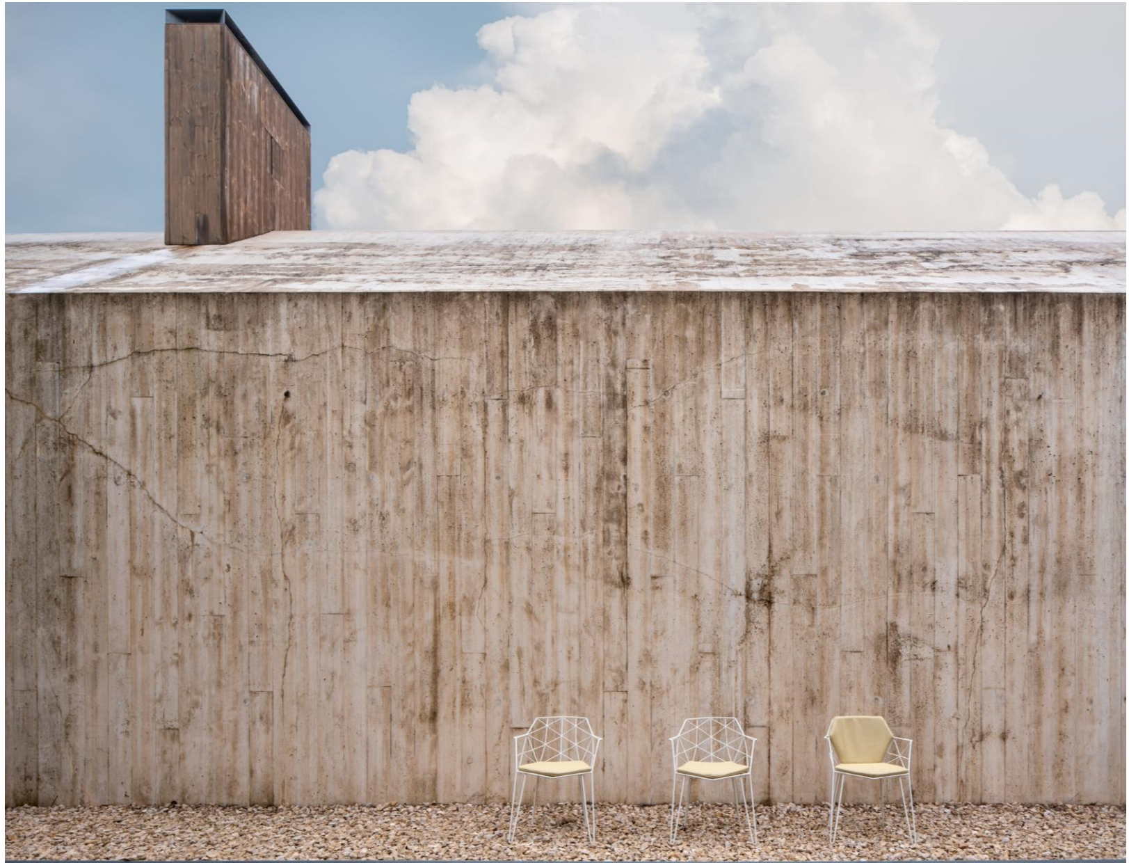
NEW MITJORN armchair