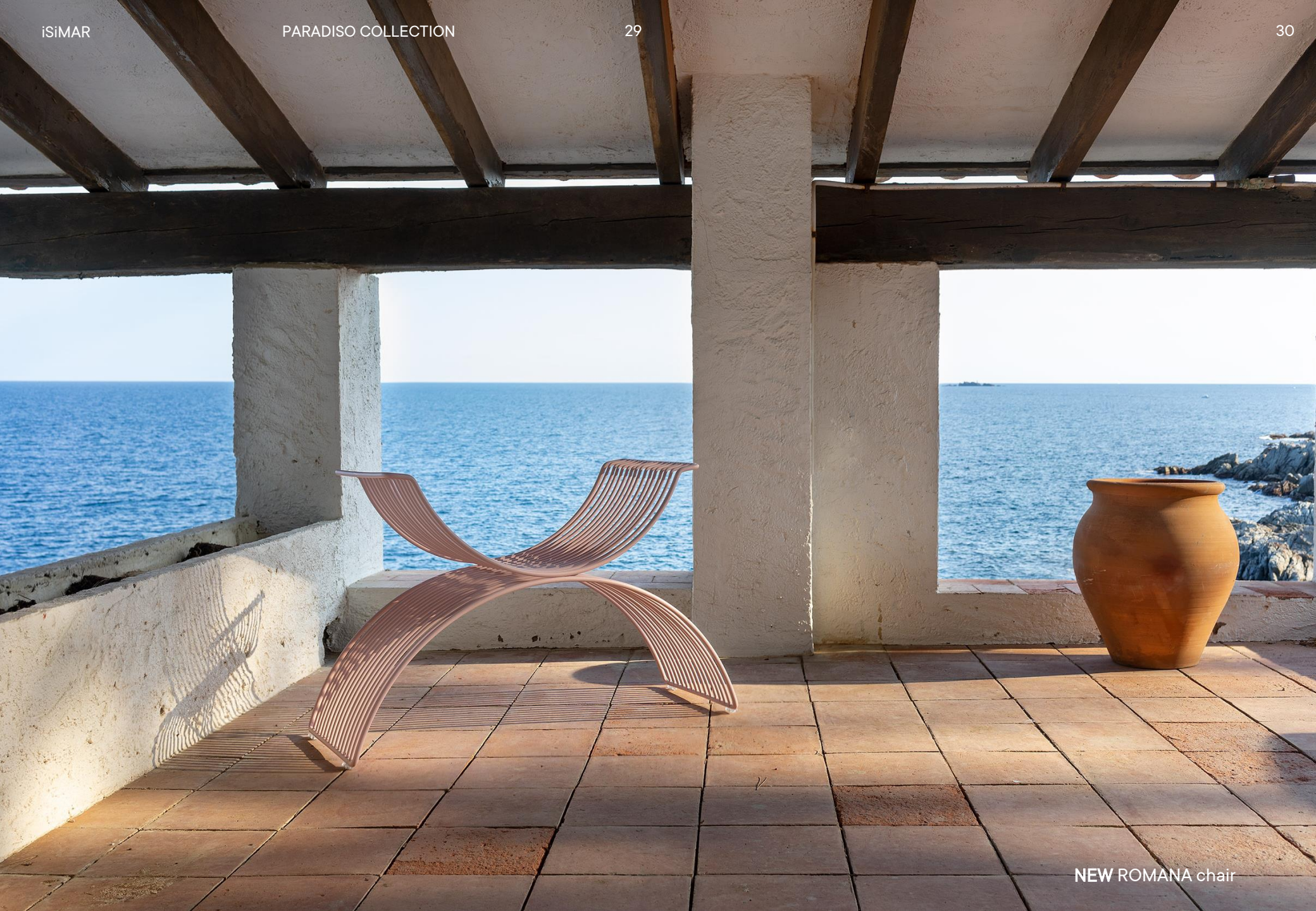
NEW ROMANA chair