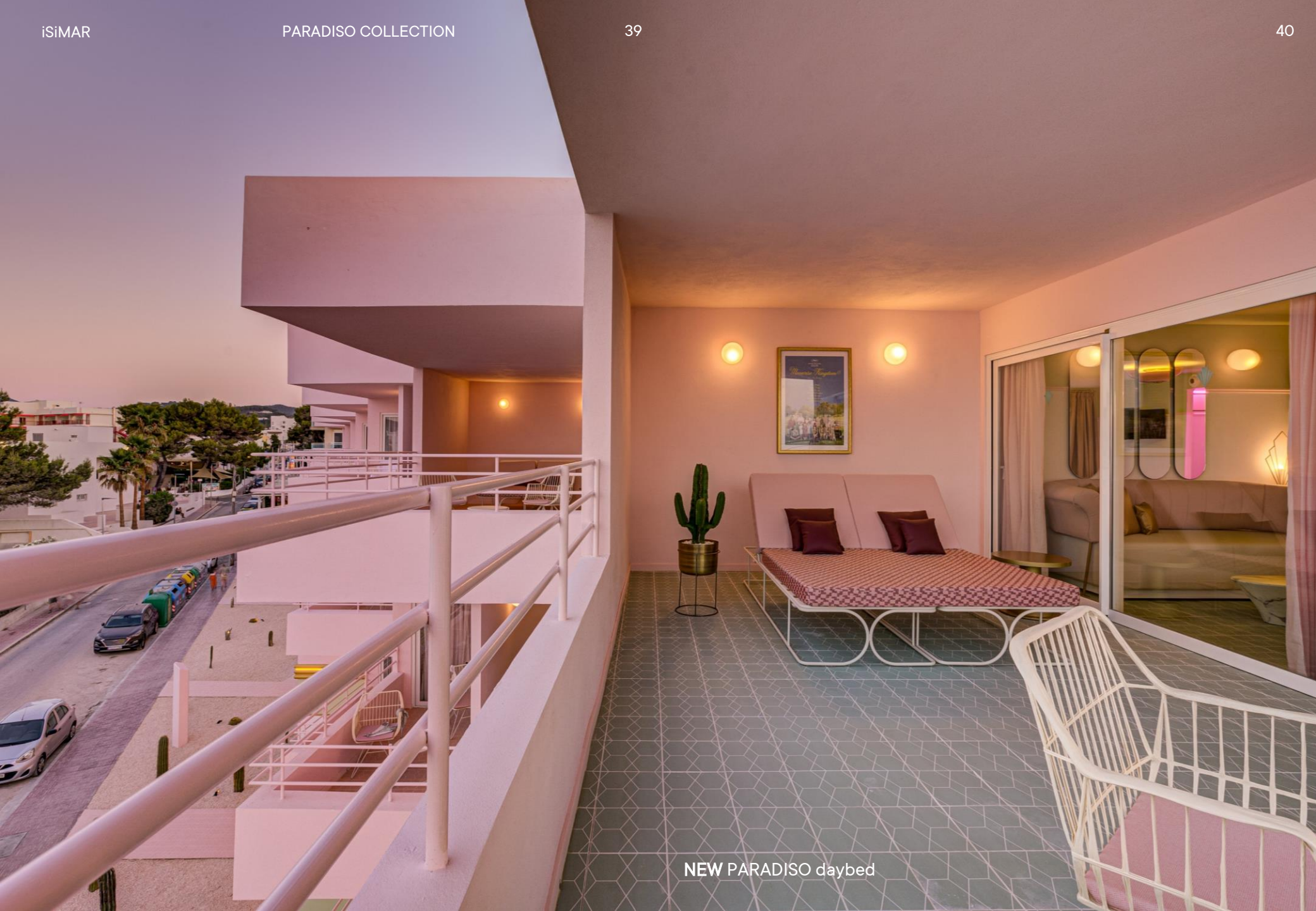
NEW PARADISO daybed