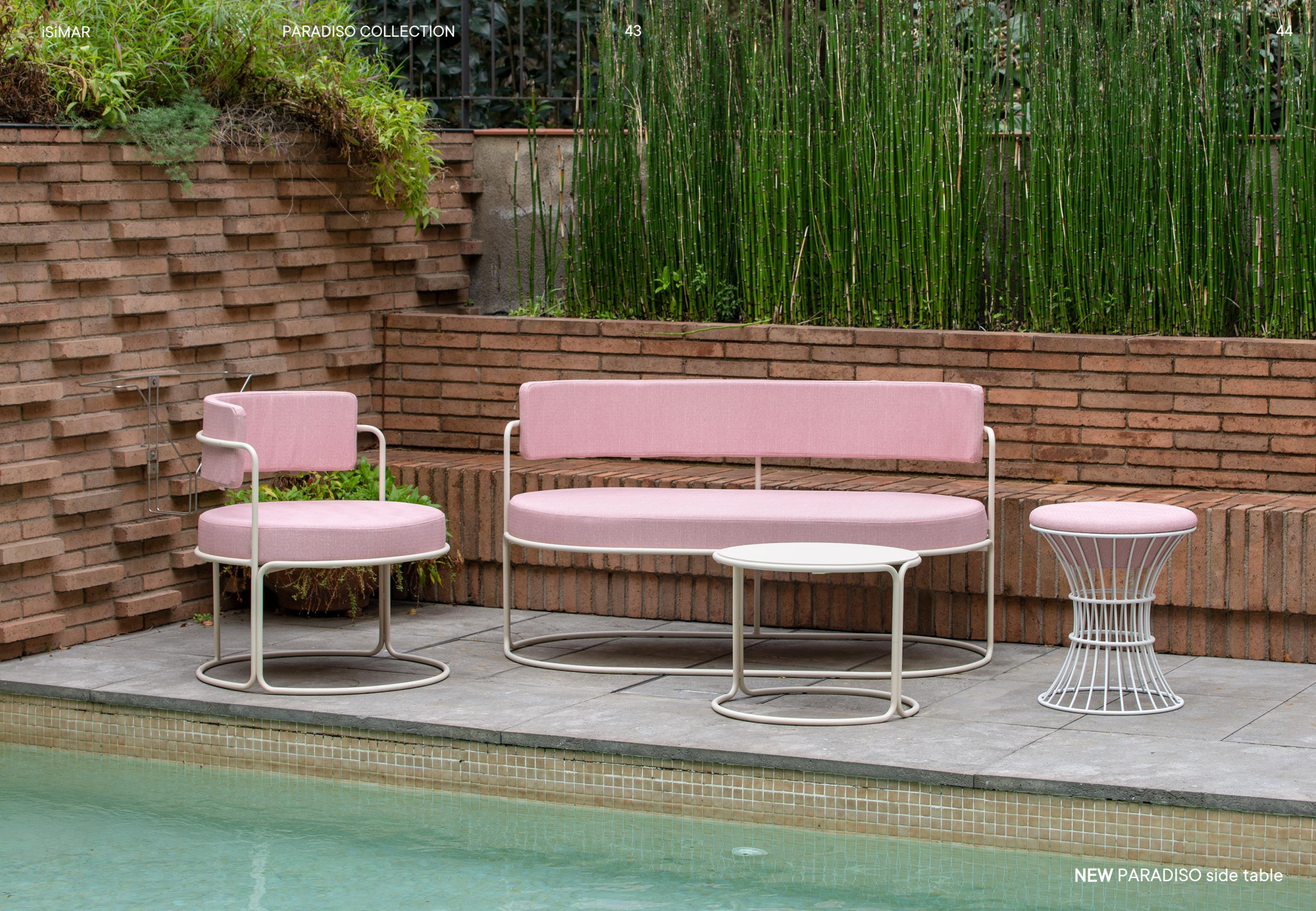
NEW PARADISO side table