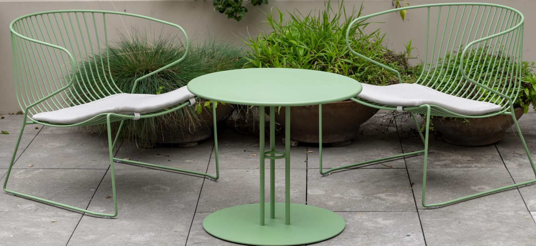
NEW BOLONIA lounge armchair