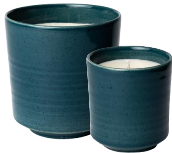
Bougie en céramique EMBRUM 50€/80€

Maison Pechavy est désormais la marque incontournable afin de créer une ambiance chaleureuse et colorée au coin du feu. Cet hiver, la marque décline ses produits phares au sein d'une nouvelle collection riche en émotions. Ainsi, plaid en mohair, bougie parfumée en céramique artisanale, bougies fines, coffret d'allume-feu et allumettes se parent d'un bleu de Prusse intense et lumineux. Ces créations se répondent autour d'une élégante cohabitation avec les bijoux bougeoirs « Folies ». Chic, utile et écoresponsable.