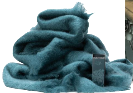
Plaid 100% Mohair 340€