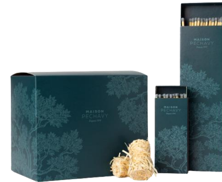
Allume-feu naturel 20 € & Allumettes Longues 10€