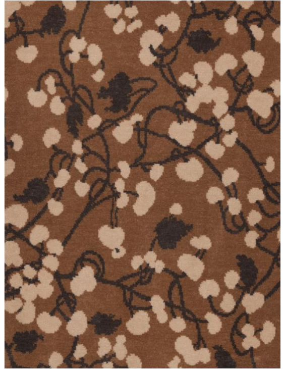
« Monnaie du Pape », motif Art Nouveau, dans la Suite #1