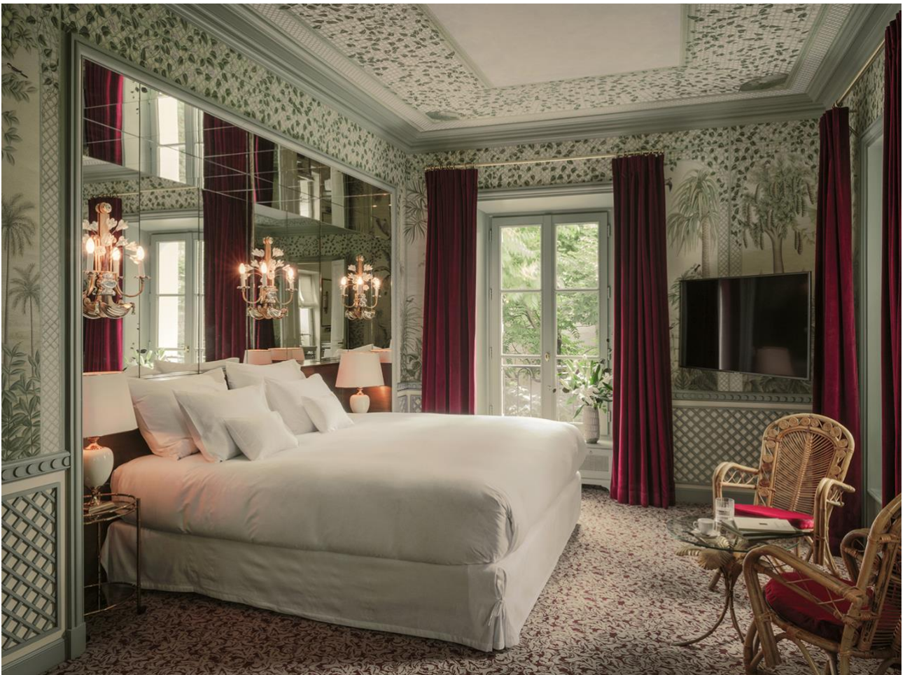
« Feuillages » dans la Suite #4