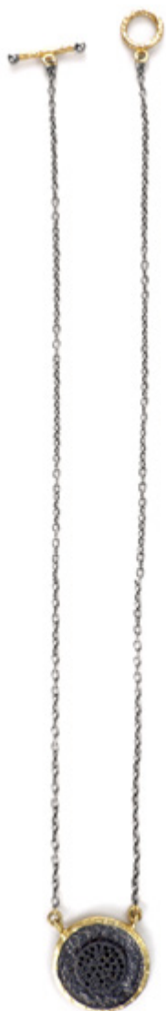
PENDENTIF PENDANT Longueur / Length 45 cm Ø 2 cm