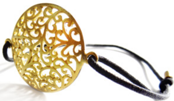
BRACELET / BRACELET Taille réglable / Adjustable size, Ø 27 mm