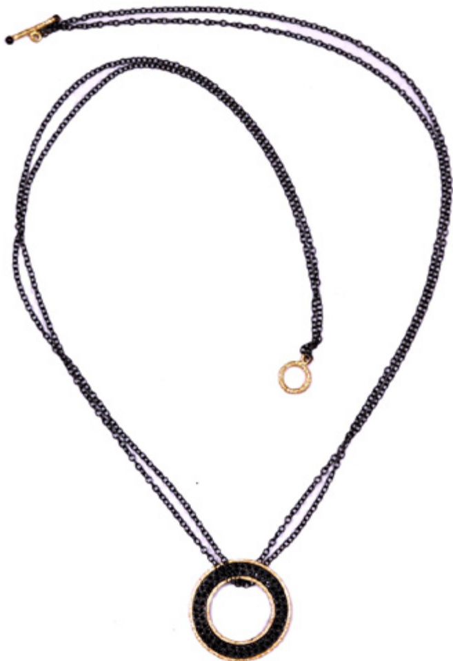
SAUTOIR MÉDAILLON, AVEC CHAÎNE MEDALLION LONG NECKLACE, WITH CHAIN Longueur / Length 34 cm - Ø 3 cm