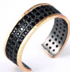
ANNEAU AJUSTABLE ADJUSTABLE RING KBAGL03S