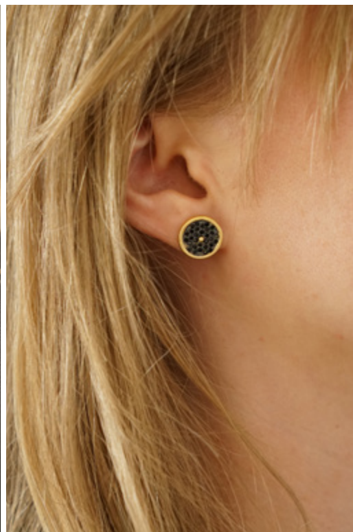
BOUCLES D'OREILLES CLOU STUD EARRINGS