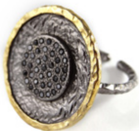
BAGUE / RING Taille réglable / Adjustable size, Ø 2 cm