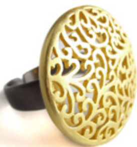
BAGUE / RING Taille réglable / Adjustable size, Ø 25 mm