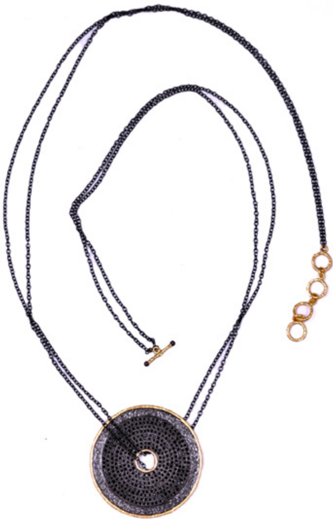
SAUTOIR TALISMAN AVEC DOUBLE CHAÎNE AJUSTABLE TALISMAN LONG NECKLACE, WITH DOUBLE ADJUSTABLE CHAIN Longueur / Length 45 cm, Ø 5 cm