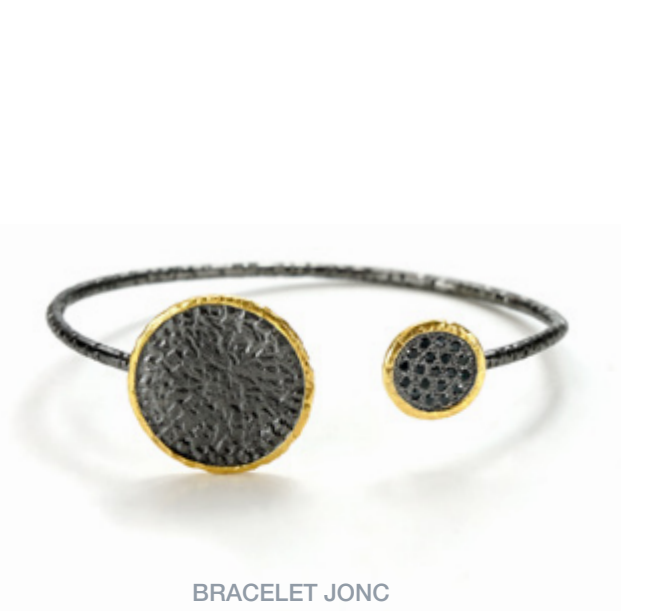
BRACELET JONG RUSH BRACELET Longueur / Length 16 cm