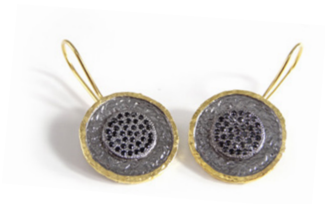
BOUCLES D'OREILLES PENDANT EARRINGS Ø 2 cm