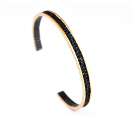
BRACELET AJUSTABLE ADJUSTABLE BRACELET