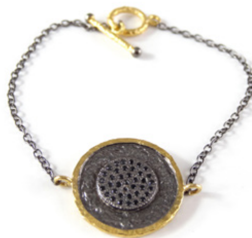
BRACELET / BRACELET Longueur / Length 16 cm, Ø 2 cm