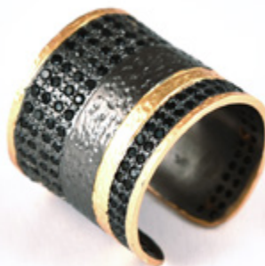
BAGUE AJUSTABLE ADJUSTABLE RING KBAGL03L