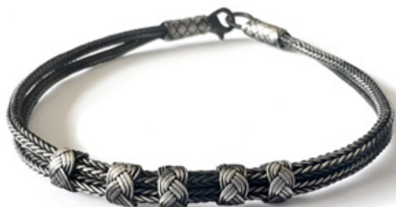
DOUBLE TRESSE FINE - 5 NOEUDS COULISSANTS DOUBLE THIN BRAID, 5 SLIDING KNOTS Argent oxydé / Oxidized silver