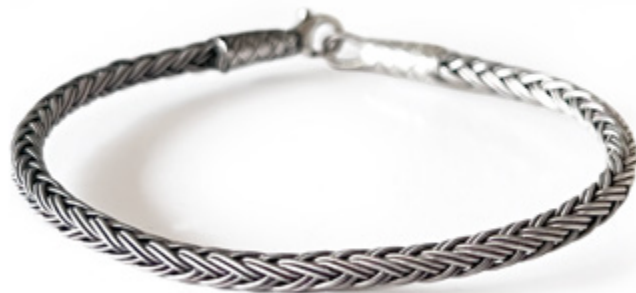
TRESSE RONDE / ROUND BRAID Argent oxydé / Oxidized silver