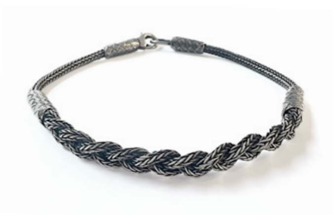
CHAINE TRESSE CHAIN BRAID Argent oxydé / Oxidized silver