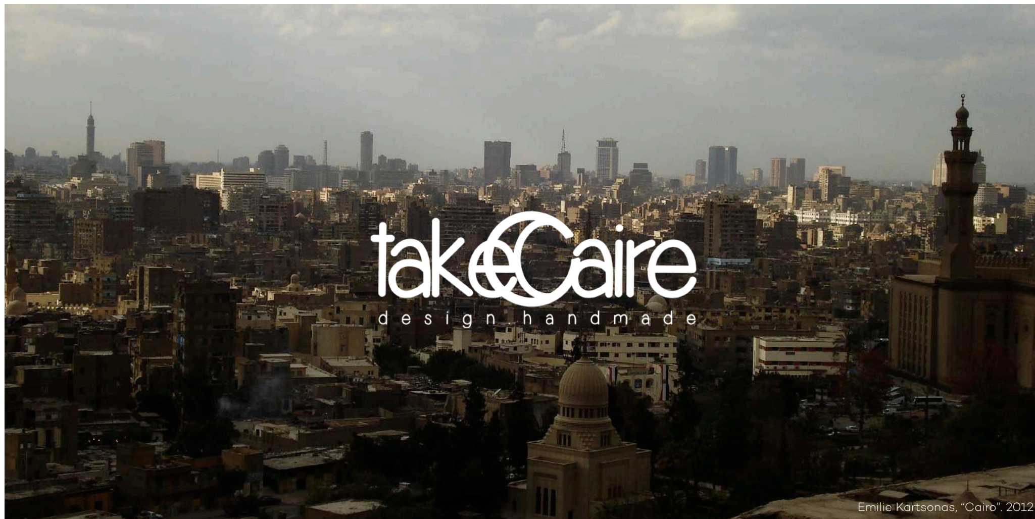
Emilie Kartsonas, "Cairo". 2012