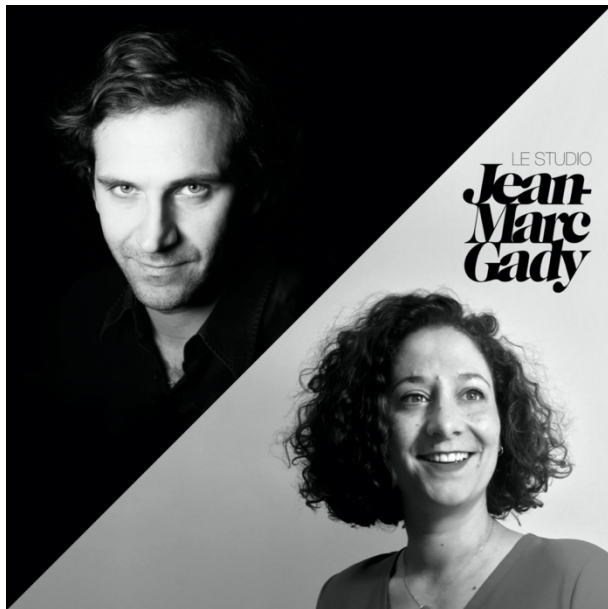
Studio Jean-Marc Gady, photo Elodie Dupuis / Studio Jean-Marc Gady

Diplômé en 1996 de l'Ecole bleue en design et architecture d'intérieur, Jean-Marc Gady débute sa carrière dans la conception de mobilier, de luminaires et d'objets dédiés à l'art de la table pour Ligne Roset et Liv'it. Il fait l'objet de plusieurs appels permanents du VIA (Valorisation et Innovation dans l'Ameublement, Le French Design) avant de rejoindre Louis Vuitton comme directeur artistique des vitrines et des mises en scènes événementielles à travers le monde. En 2006 il crée sa structure de création avec pour vocation d'être pluridisciplinaire. Le Studio Jean-Marc Gady répond à des projets de design d'objet, d'architecture intérieure, de scénographie et de muséographie. Il compte à son actif de prestigieuses collaborations avec Louis Vuitton, Baccarat, Diptyque, Montblanc... En 2014, sollicité par Apple pour sa vision et son expertise, Jean-Marc Gady débute une aventure californienne. A Paris, son studio de création mené par une équipe fidèle poursuit son activité en design et espaces. Parmi ses références : Montblanc, Diptyque, Baccarat, Perrouin, Berlutti, Guerlain, Ligne Roset ... Pour NOMA, Jean-Marc Gady développe une d'art de la table en céramiques recyclée.