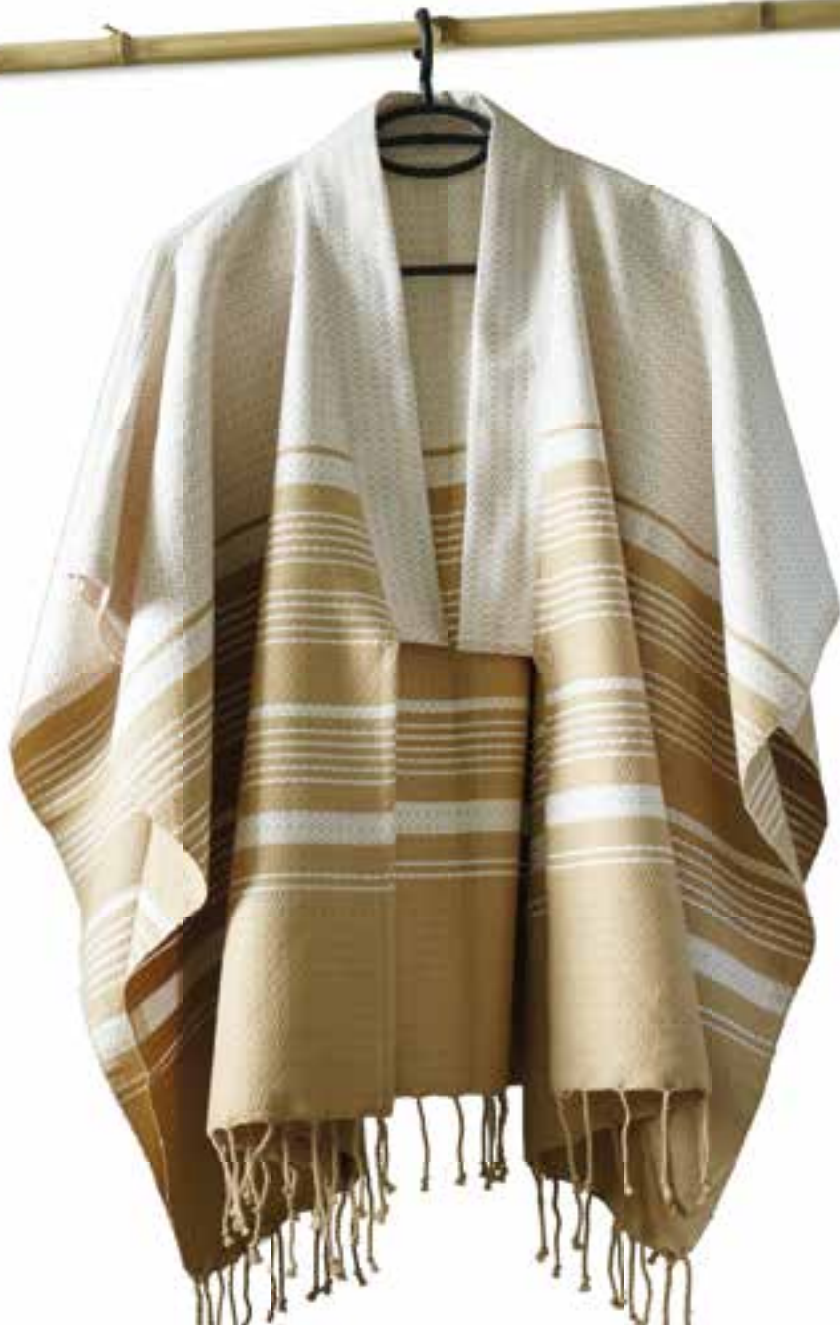
SAND BLANC PURE