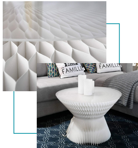
Table papillon Facile à déplier, à déplacer, à ranger !