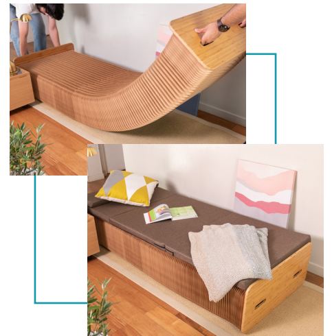
Lit d'appoint Recevoir même dans un studio !