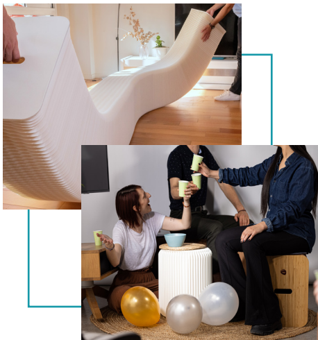
Banc 6 personnes Adieu les chaises pliantes !