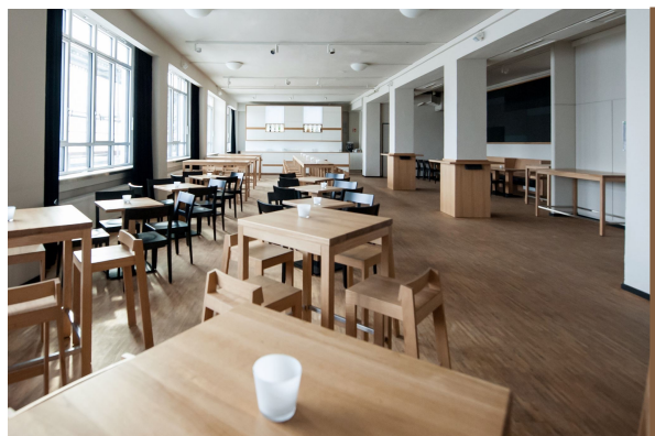
Café Oelsner - Hambourg - Allemagne

Cette fabrication artisanale n'exclut pas pour autant l'utilisation de machines et de procédés innovants.