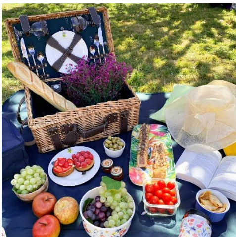
Champs-Elysées Bleu (2 personnes) : 194€

Le Champs-Elysées a été spécialement conçu pour des sorties pique-niques aux allures royales ! Toujours en cuir véritable, le panier Champs-Elysées est particulièrement luxueux. Il est en effet doublé d'un tissu monogrammé, associé à du cuir grainé et surpiqué de haute qualité. Avec ses assiettes en porcelaine, ses couverts en acier inoxydable, ses verres, sa poivrière et salière ainsi que son tire-bouchon, il possède tout le nécessaire pour le bon déroulement d'un pique-nique.