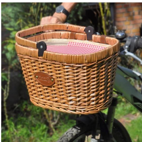
Panier Vélo Chantilly Vichy Rouge : 42,90€

Utiles et pratiques, ils s'attachent facilement au guidon d'un vélo. Avec leurs sangles rabattables, ils sont faciles à transporter, et peuvent aussi servir de paniers pour les sorties au marché.