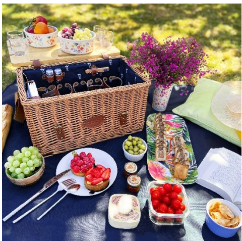
Saint-Honoré Bleu (4 personnes) : 186€

Grâce à sa table en bois intégré, le panier Saint-Honoré sait recevoir ses convives ! Également muni d'une nappe enduite imperméable et de serviettes en coton, il a tout d'un panier chic et pratique pour déjeuner confortablement sur l'herbe. Ses couverts sont rangés dans une pochette monogrammée, pour un côté toujours plus haut de gamme. Toutes ses sangles sont en cuir véritable, ce qui lui procure un aspect luxueux et indémodable !