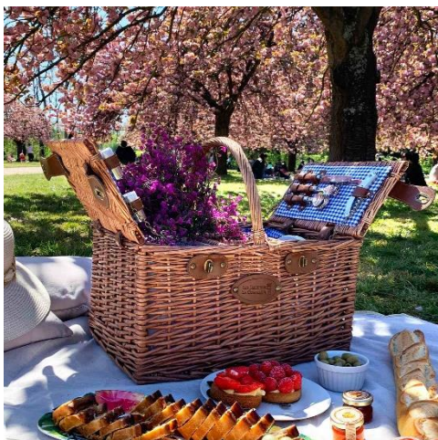
Saint-Germain Vichy Bleu : 139 €

Le panier Saint-Germain est un des grands succès de la marque ! Déjà disponible en vichy vert et rouge, ce panier a été cette fois-ci décliné en vichy bleu afin de satisfaire tous les goûts et toutes les envies ! Parfait pour les pique-niques champêtres et traditionnels, il dispose de 3 casiers pour y ranger toutes sortes de bouteilles. Avec sa couleur brun foncé, ce panier révèle un charme authentique !