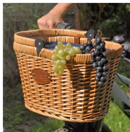
Panier Vélo Chantilly Bleu : 42,90€

Les paniers Vélo Chantilly Bleu et Vichy Rouge sont indispensables à prendre avec soi lors de longues balades à vélo ! Leurs grands compartiments isothermes permettent de ranger toutes sortes de collations et boissons, en les gardant bien au frais.