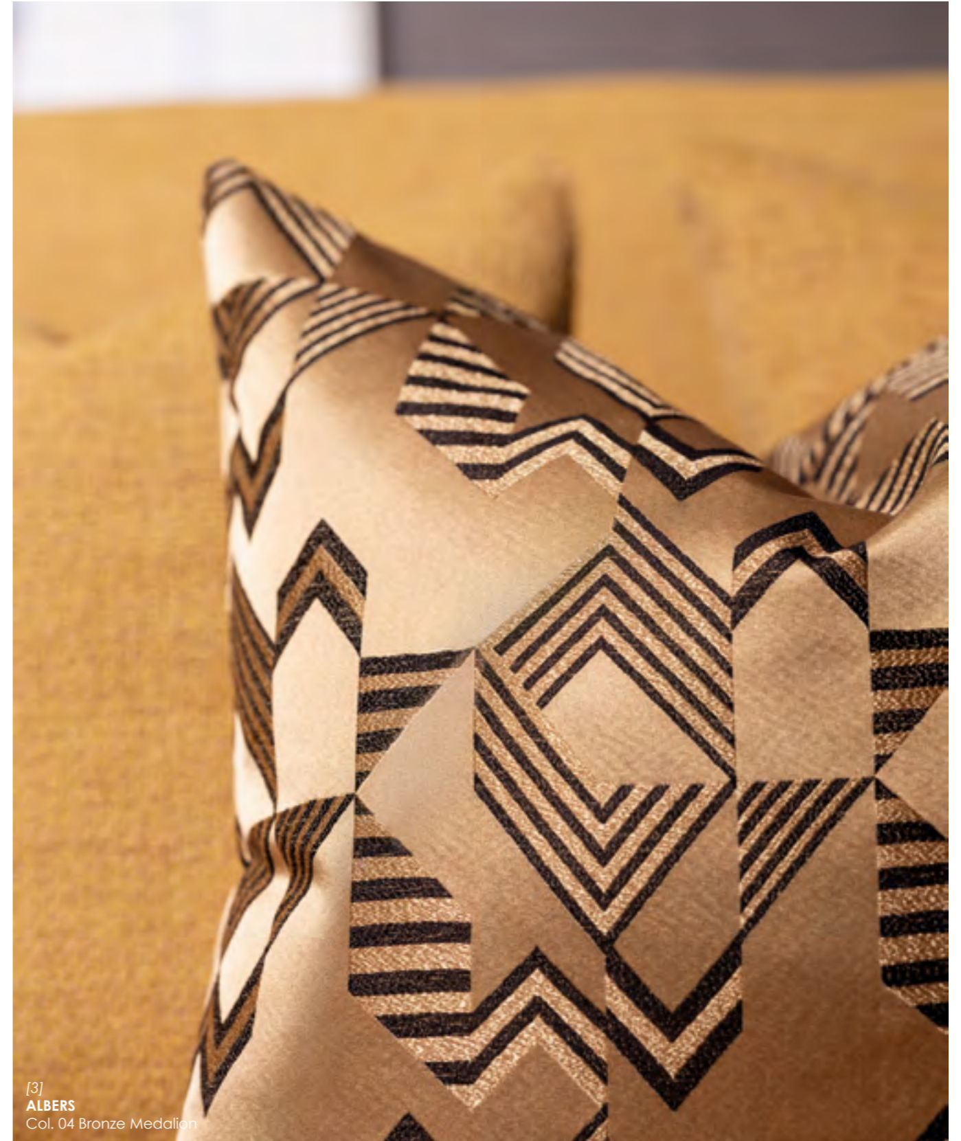
[3] ALBERS Col. 04 Bronze Medallion