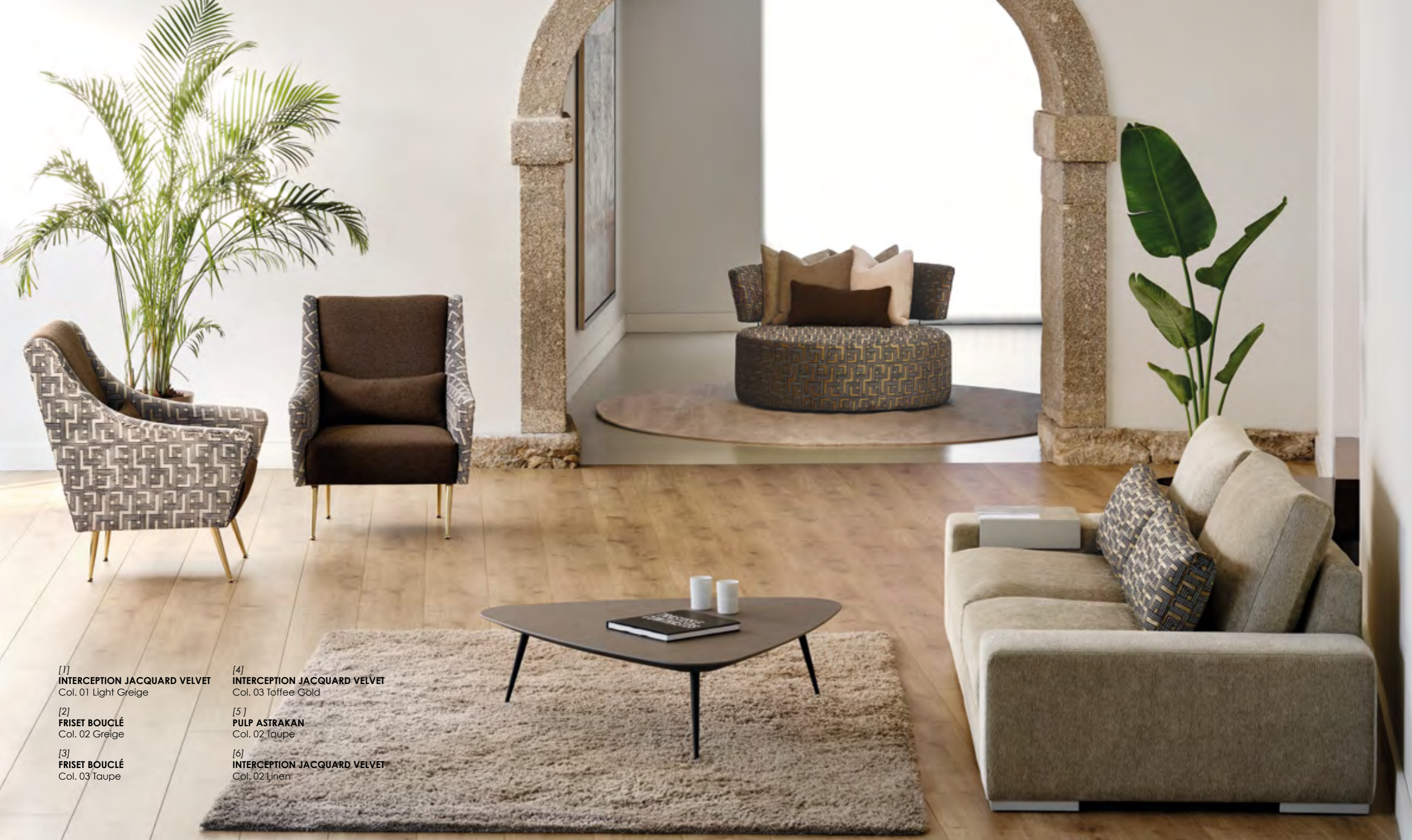
[1] INTERCEPTION JACQUARD VELVET Col. 01 Light Greige