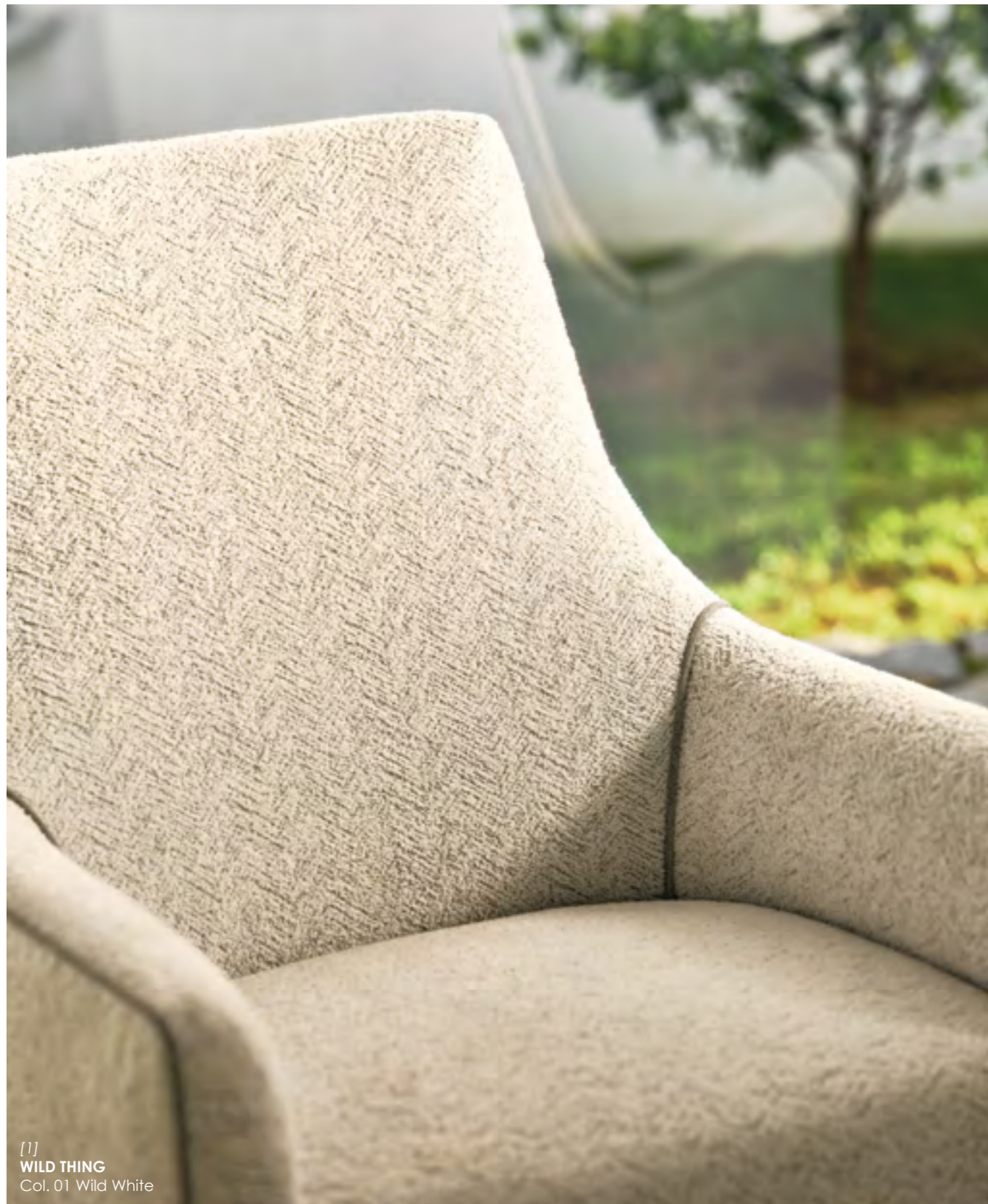
[[ WILD THING Col. 01 Wild White