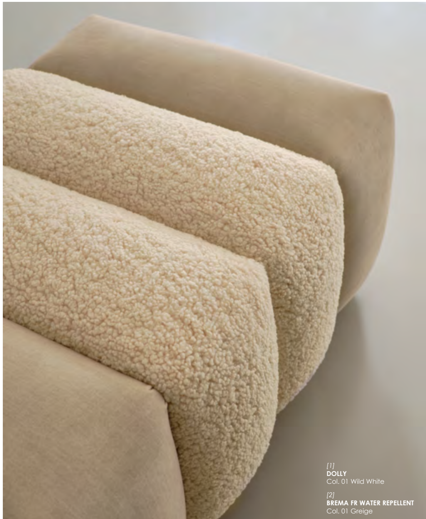
[1] DOLLY Col. 01 Wild White [2] BREMA FR WATER REPELLENT Col. 01 Greige