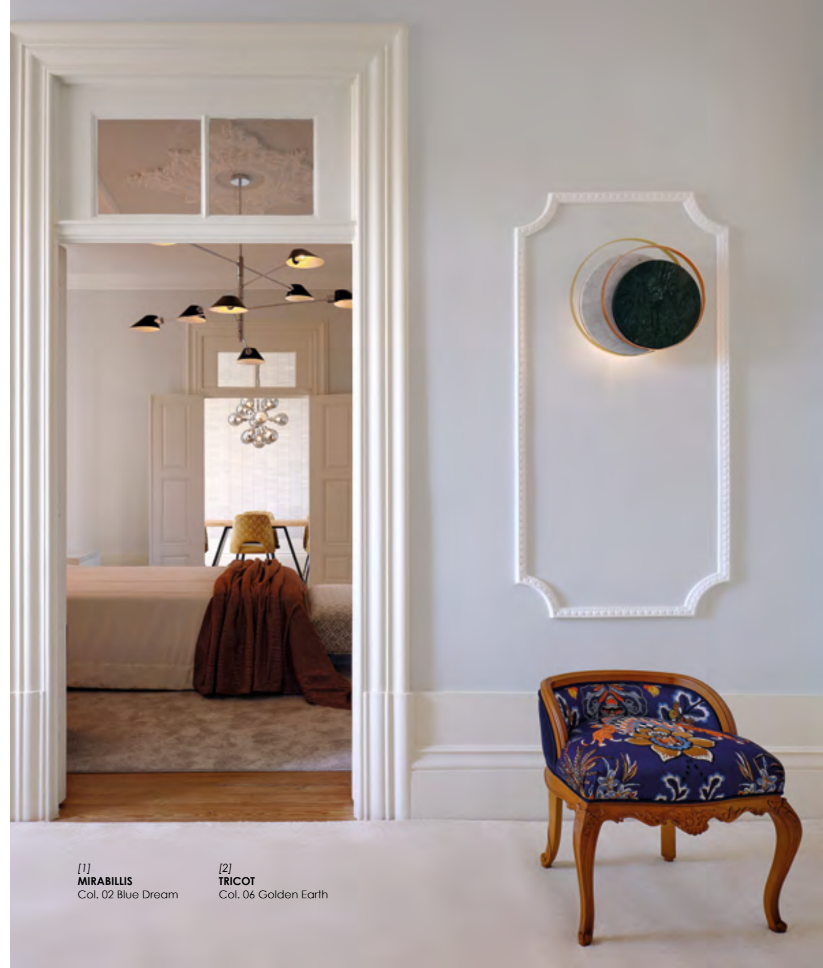
[1] MIRABILLIS Col. 02 Blue Dream

INVICTA remonta ao berço da civilização, às origens, à busca de expressão bruta e de um património valioso. O reflexo da arte e da ciência humana, preservado e enriquecido por artistas resilientes, pessoas de outras épocas e diferentes origens, reunindo o conhecimento e o artesanato, ofícios do passado com a perícia do futuro. A experimentação de materiais e texturas, volumes e conceitos, explorando geometria e dimensão, mantendo-se forte nas suas convicções e conquistando seu lugar no tempo e na História, moldando não apenas esta coleção, mas também a vida.