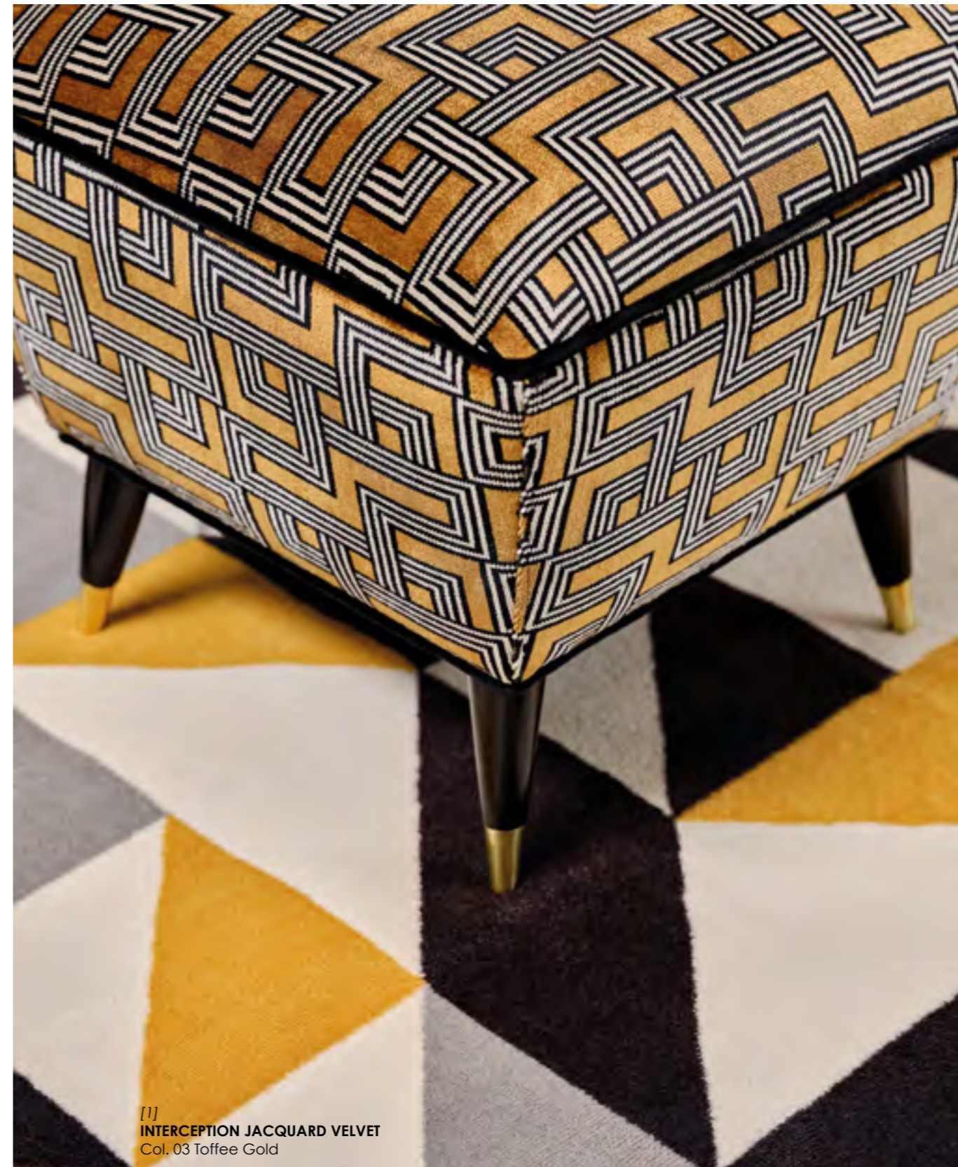
[1] INTERCEPTION JACQUARD VELVET Col. 03 Toffee Gold