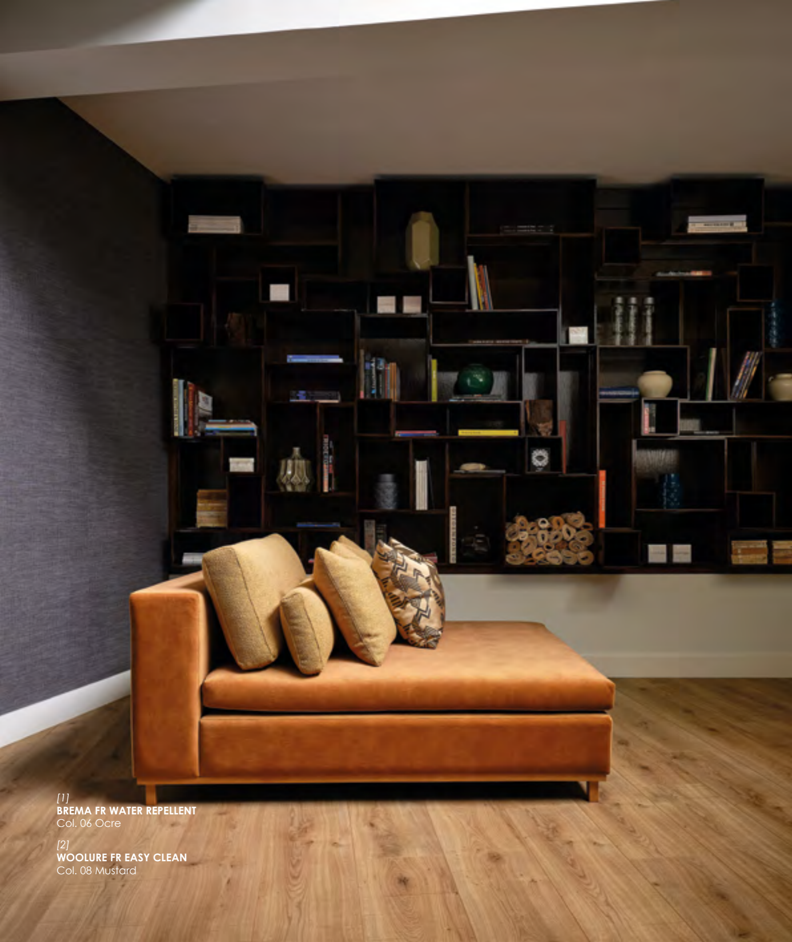
[1] BREMA FR WATER REPELLENT Col. 06 Ocre