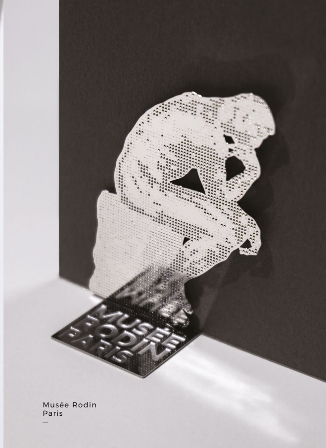
Musée Rodin Paris