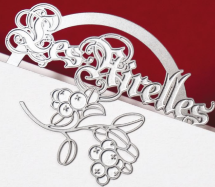
Hôtel Les Airelles Courchevel