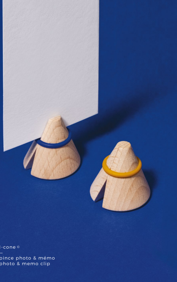
I-cone © — pince photo & mémo photo & memo clip