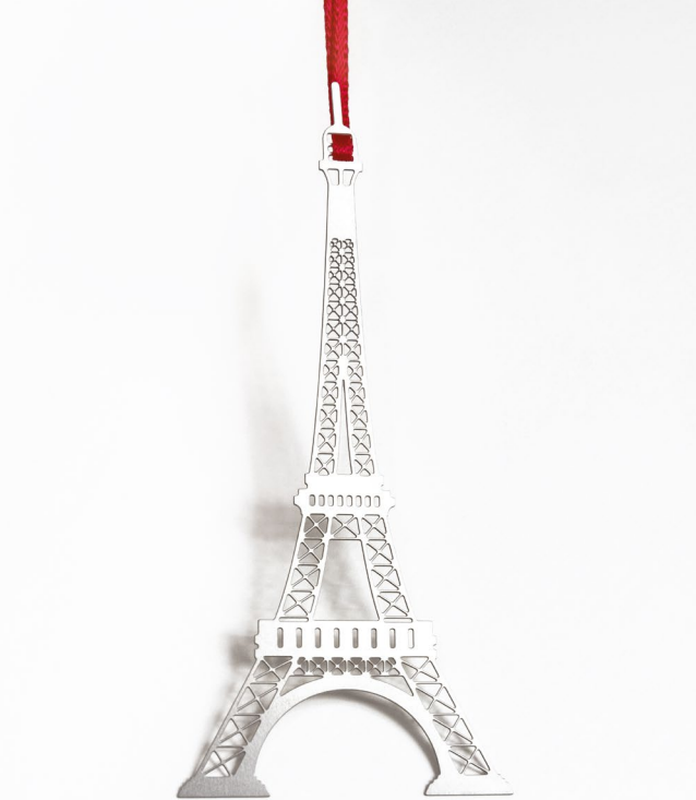
Tour Eiffel — marque page bookmark