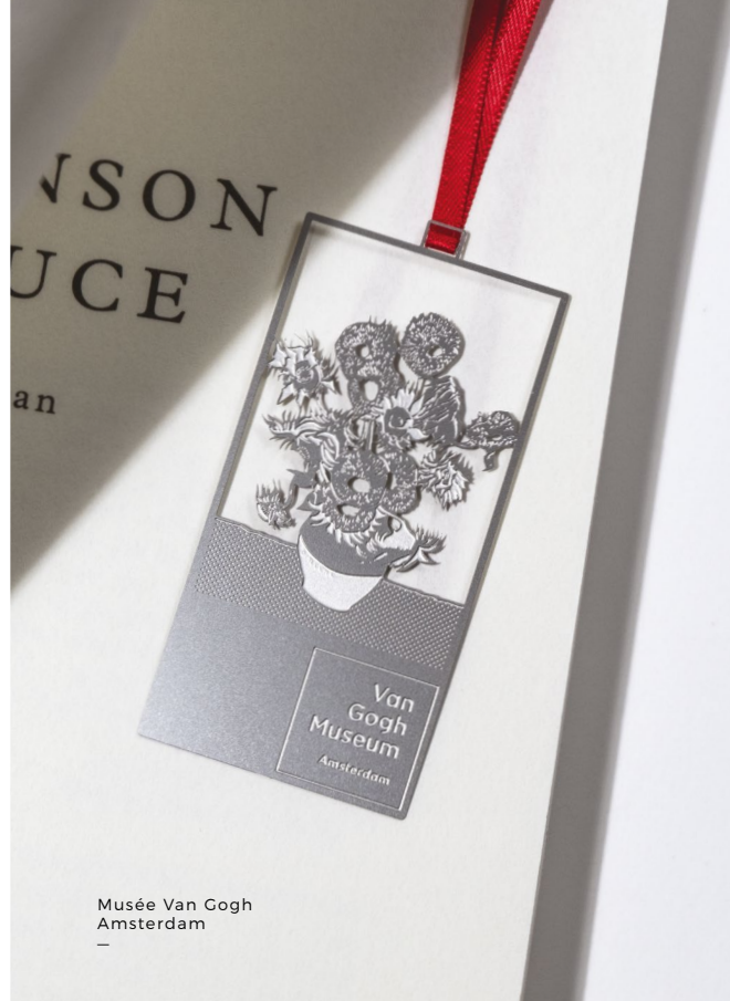
Musée Van Gogh Amsterdam