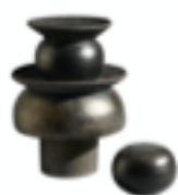
maison marcoux mexico

Pour contempler cet ensemble, le visiteur peut s'asseoir un instant sur l'élégant banc conçu par Binôme ou s'arrêter pour savourer un café Nespresso ou un jus de fruits Alain Milliat . Il peut ainsi porter son attention sur les céramiques tournées entièrement à la main de Katia Jacquet ou encore sur celles éditées par la maison marcoux mexico , qui sont le fruit d'une collaboration entre Constance Guisset pour le design et l'artisan mexicain Labo Martinez pour la fabrication. Les lignes industrielles de la suspension de Samuel Accocberry et Bruce Cecere (label SB26) illuminent la pièce.