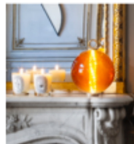
Jean-Michel Othoniel, Perle (g)