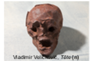
Vladimir Veličković, Tête (m)

Au gré de ses déambulations, le visiteur peut aussi admirer les céramiques Intérieur de Pauline Bazignan . Ces empreintes d'écorces d'agrumes résonnent comme un appel à l'introspection et font écho de ce fait au thème du Voyage Intérieur de cette 9 e édition. Les vanités (sculptures en forme crânes) de l'artiste Vladimir Veličković (LÆIL Gallery)