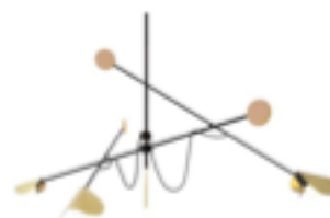
SB26, Moon suspension (k)

La chambre se teinte d'une note littéraire avec les dessins sur livre de France Bizot (Backslash) , illustrant avec ironie des premières de couverture de romans très variés. En parallèle de cela, Brankica Zilović (L'ŒIL Gallery) choisit de figer des pages de livres en y incorporant de la broderie. Les dessins à l'encre de chine de Christelle Téa viennent ensuite séduire le regard par leur délicatesse et leur minutie.