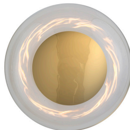
Horizon Ø29 Clear