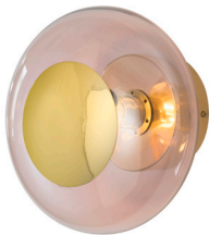
Horizon Ø21 Bright Coral

La collection Horizon est fabriquée en verre soufflé. Elle existe en trois tailles et en pleine de couleurs dans des tons indémodables. Elle se prête aussi bien au style Nordique épuré qu'aux styles plus éclatants et spectaculaires. Son design est une solution idéale pour tous types de salle de bain.