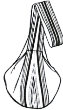
si dilata/it expands