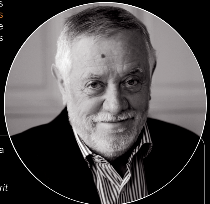
Yves Coppens (juin 2014) Professeur au Collège de France paléoanthropologue

* Concours Lépine International Paris 2016 Concours Lépine Européen Strasbourg 2016 Salon des Inventions Genève 2017