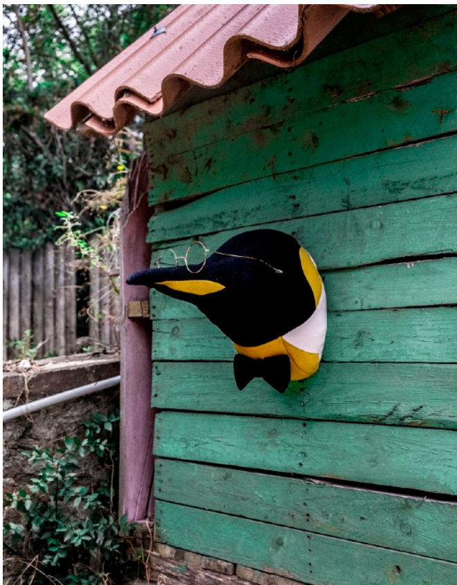
1. Soft Penguin - Leopold laine, lunettes et papillon