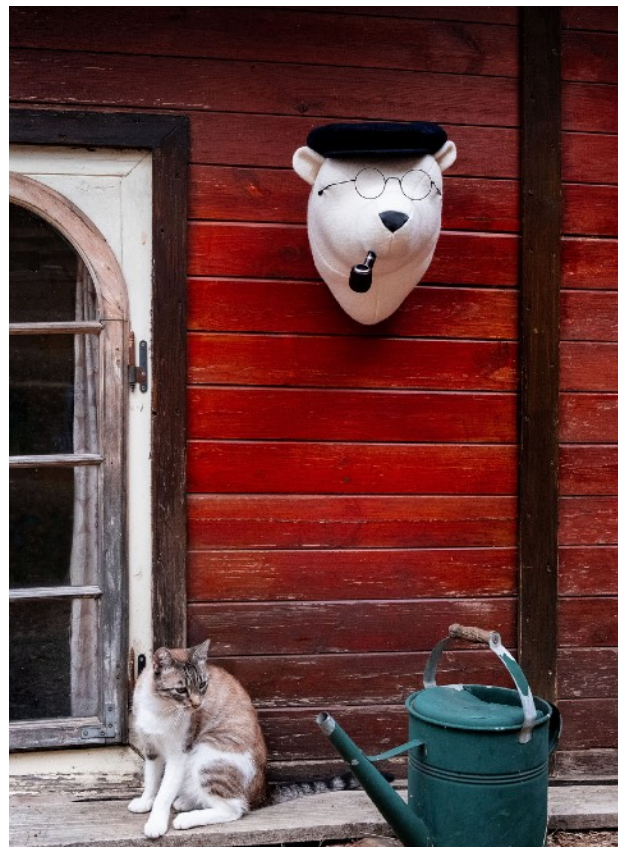
2. Soft Bear - Otto laine, lunettes, chapeau et pipe