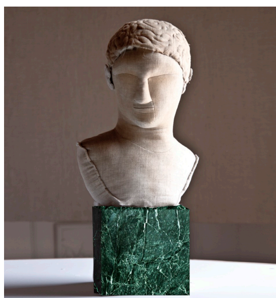
1. Meat, Bust and Coral (2019) lin et velour antique mesures variables